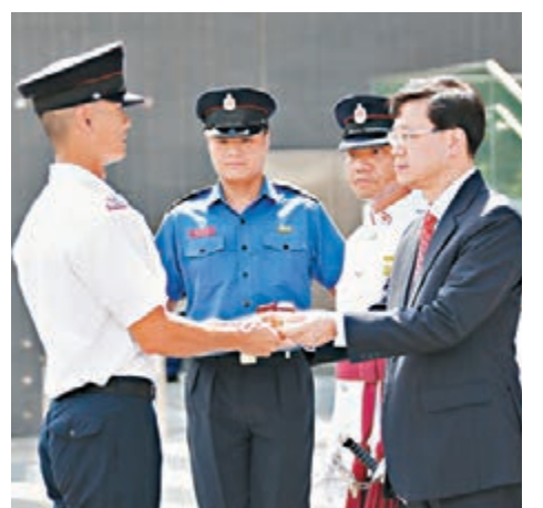
■李家超(右一)頒發最佳學員獎。

會操後，結業學員即席示範模擬撲滅火警及救護工作。170名學員完成26個星期訓練後，將會被調派到不同的消防局及救護站駐守。