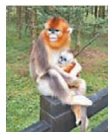
當地對金絲猴保育及林區生態保護做了很多細緻工作。

港區全國人大代表團還在十堰市，到房縣參觀了野人谷鎮西蒿坪村精準扶貧及土城黃酒民俗村的打造，了解當地新農村的建設情況。