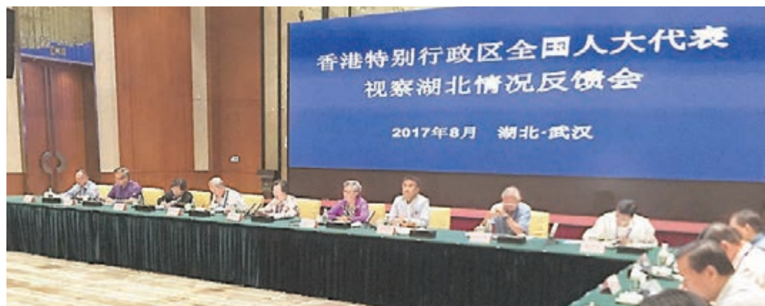
港區全國人大代表團在湖北進行為期8天視察。