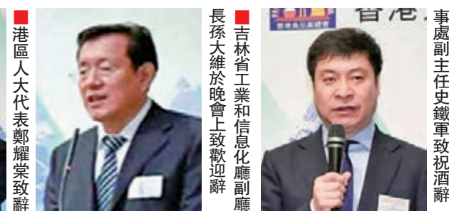
港區人大代表鄭耀榮致辭