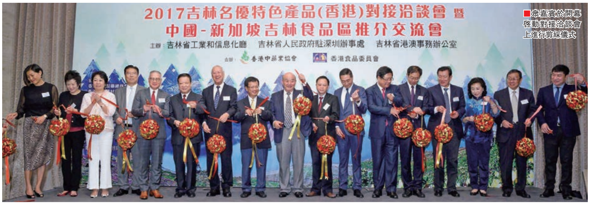
嘉賓於開幕啟動對接洽談會上進行剪綵儀式

吉林省人民政府為推廣吉林優質食品和藥材產品,每年均在香港舉行對接洽談會,深受香港業界歡迎。本年「2017吉林名優特色產品(香港)對接洽談會暨中國-新加坡吉林食品區推介交流會」日前假北角港島海逸君綽酒店舉行,由吉林省工業和信息化廳、吉林省人民政府駐深圳辦事處和吉林省港澳事務辦公室聯合主辦,並由香港中藥業協會和香港食品委員會擔任合辦機構,也獲得了香港10家知名相關商會作協辦單位。