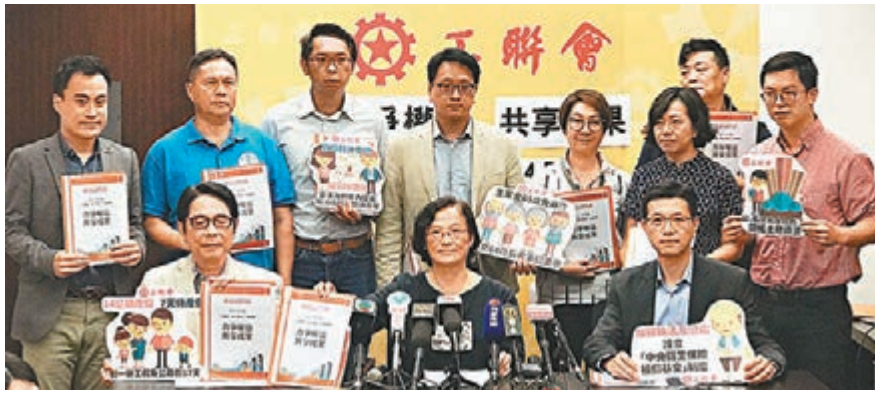
工聯會昨日與特首林鄭月娥會面,促請政府落實多項勞工權益及增加公營房屋供應等。

工聯會會長林淑儀、理事長吳秋北、副會長黃國健,立法會議員麥美娟、郭偉強、何啟明、陸頌雄,勞顧會僱員代表鄧家彪昨日與林鄭月娥會面,歷時約1小時。工聯會向林鄭月娥提出了涉及勞工權益,以及增加公營房屋供應、改善長者福利等建議(見表)。