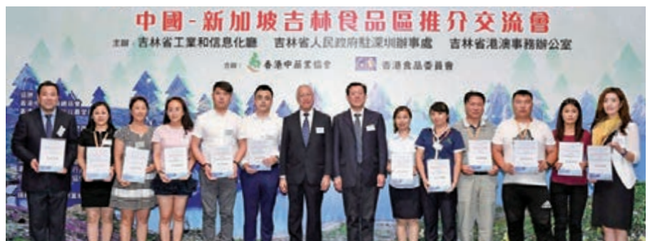
吉林省參展企業與主禮嘉賓合照