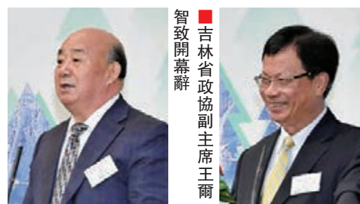
吉林省政協副主席王爾智致開幕辭