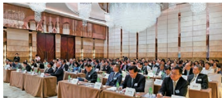
洽談會會場座無虛設