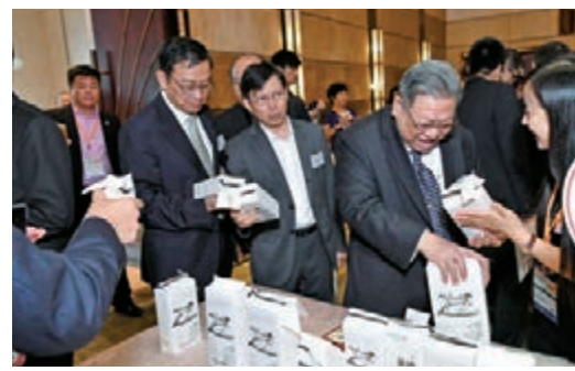
吉林大米名聞天下