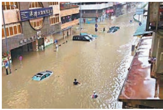
■ 颱風後，大批汽車淹在澳門馬路上。