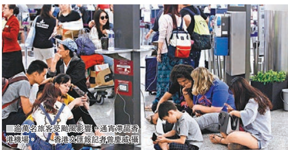
■ 逾萬名旅客受颶風影響，通宵滯留香港機場。

有昨日凌晨到達碼頭的澳門居民表示，與家人原定從德國坐飛機來香港，再坐船返回澳門，但抵港的客機因颶風而延誤，以致凌晨才能到達碼頭。