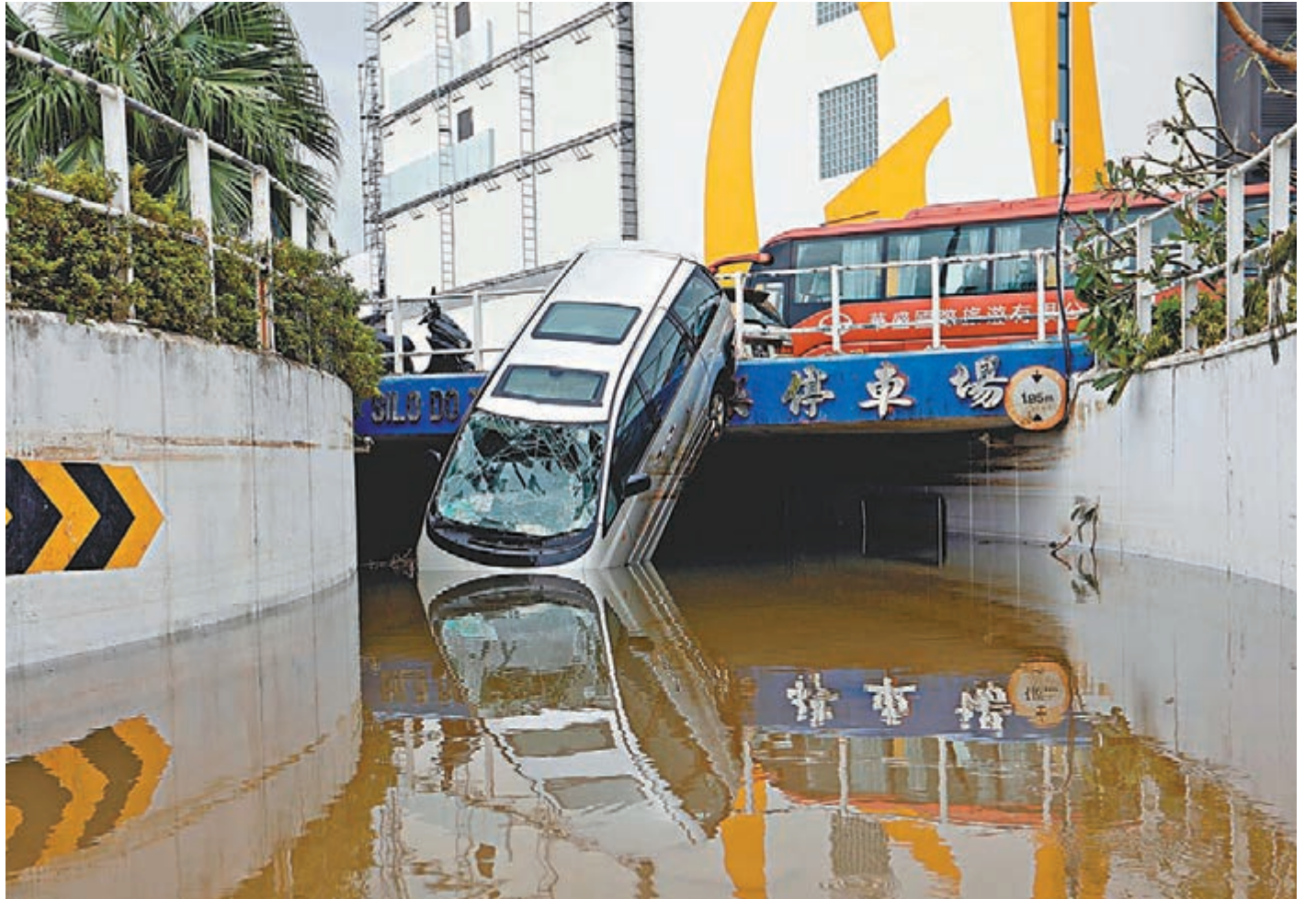
■ 一輛汽車被潮水沖走，橫亘在停車場，真正插水。