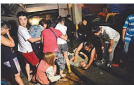
■ 其中一名死者被澳門海關蛙人搜獲，眾親人悲痛不已。

香港文匯報訊（記者 文森）「天鴿」肆虐，水浸香港杏花邨的地下停車場，幸無人命傷亡，但在澳門就有市民因潮水沖入地下停車場而喪命。兩名澳門人前日上午被潮水沖入典雅灣停車場內。兩人失蹤16小時後，海關蛙人搜出兩名失蹤者的遺體，在現場守候多時的死者家屬都悲痛不已。此外，多個據傳有人被困的停車場排水和搜救工作仍然繼續，不排除死亡人數會增加。