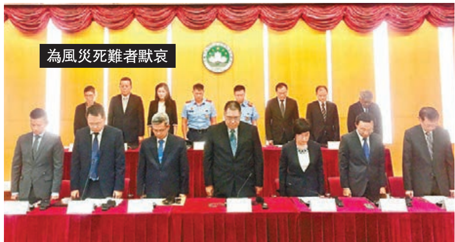
■ 崔世安昨日傍晚帶領一眾官員，為風災死難者默哀1分鐘。

香港文匯報訊（記者 文森）颱風「天鴿」前日吹襲澳門，造成嚴重破壞，近岸大部分地區出現嚴重水浸，潮漲加上暴風，將潮水推至岸上1.5米，居民更斷水斷電。截至昨日傍晚6時，「天鴿」已經奪走8人生命，至少已造成153人受傷。截至昨日上午9時，內地對澳門的供電已基本恢復，但有4萬戶住宅因供電設施受水浸破壞，仍然斷電；澳門水廠受制於供電的問題，只能作有限度供水，多區至昨晨仍未有食水供應。澳門行政長官崔世安昨日向死難者表示哀悼，並批准氣象局局長馮瑞權的請辭。