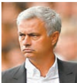
摩連奴一改曼聯十多年成規。

另外，《每日郵報》稱，摩連奴除了沿用了十多年的一項成規。之前每逢曼聯主場賽前一天，球員都會全體入宿酒店，然而摩連奴新球季已准許球員在主場賽前各自回家，以展示對麾下的信任。新安排獲得大部分球員支持，但有少數球員擔心這恐會令戰意有所鬆懈。