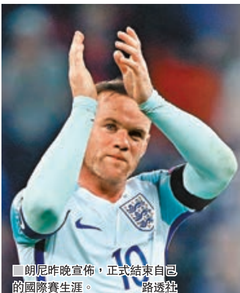
朗尼昨晚宣佈，正式結束自己的國際賽生涯。

從去年起一直落選的英格蘭國家足球隊歷史「士哥王」朗尼，昨晚表示「三獅軍」領隊修夫基縱有意重召他，但他已作出告別國際賽生涯之決定，正式退出國家隊。