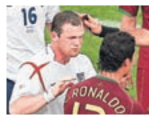
2006年世界盃，朗尼被逐離場，不滿C朗向球證撻火，成為其中一個經典場面。

正式賽事入球荒。及後作客俄羅斯他有入球卻累失12碼輪波，埋下無緣2008歐國盃決賽周伏筆。隨着朗尼成熟脾氣收斂，他於2009年首次當起三獅隊長，2014年升為正隊長。2015年9月9日對瑞士，朗尼轟入12碼，以50球超越名宿卜比查爾頓成為英格蘭隊史第一射手。