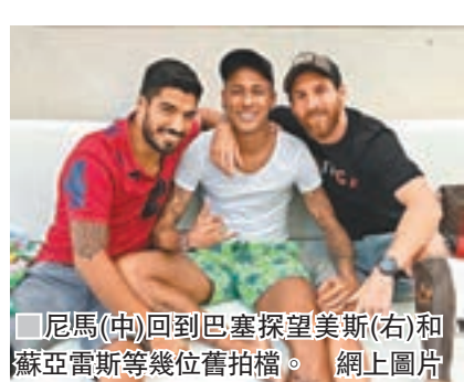
尼馬(中)回到巴塞探望美斯(右)和蘇亞雷斯等幾位舊拍檔。