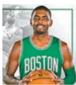
艾榮正式加盟塞爾特人。

塞爾特人圖片事事如意。」塞爾特人上季取得常規賽東岸龍頭寶座，兩人功不可沒。不過，球隊結果在季後賽中遭到騎士淘汰。