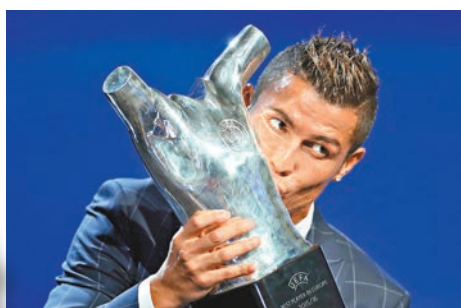
C朗有望蟬聯歐足協年度最佳球員。