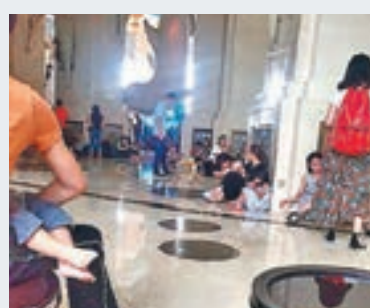
旅客被困橫琴灣酒店。

而在颶風登陸前一天,珠海長隆國際海洋度假區提前宣佈23日全天閉園,但仍有部分不知情遊客昨日上午趕到度假區,得知閉園後只能就近尋找地方躲避颶風。