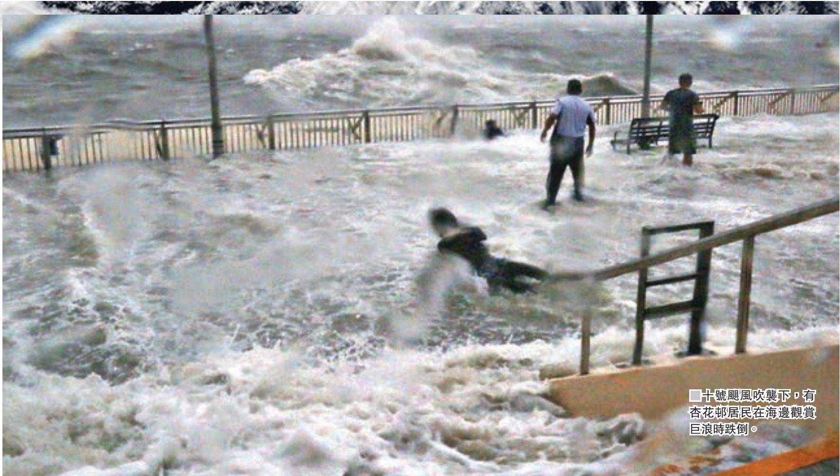
十號颶風吹襲下，有杏花邨居民在海邊觀賞巨浪時跌倒。

大嶼山石壁監獄亦遭「天鴿」破壞，昨晨10時至中午1時十號風球高懸期間，巨浪不斷拍打上岸，浪花一度高達8米，蓋過對面近岸的沙咀勞教職員中心宿舍。海水之後不斷湧入石壁監獄懲教職員宿舍範圍，多輛停泊在宿舍樓下的私家車被水淹沒，有車輛被水沖走。