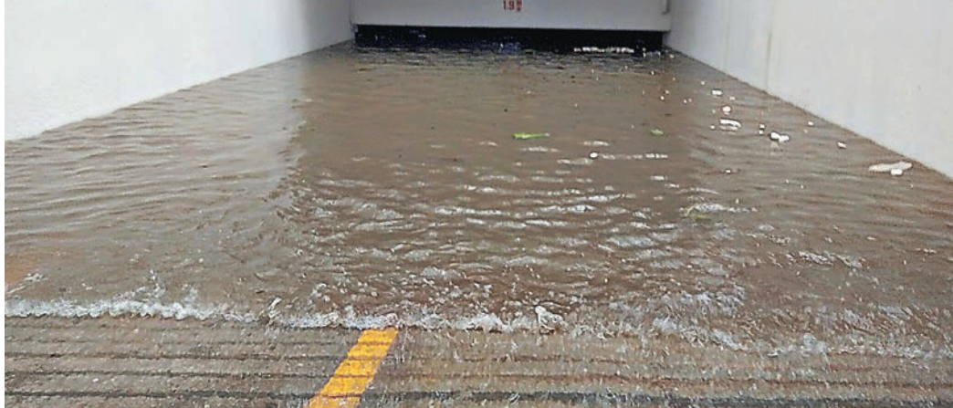
杏花邨內1.9米深的地庫停車場「水浸」。

紅磡豪宅「昇御門」亦出現意外，有單位的窗戶遭工程吊船撞爆。羅少雄指出，若業主或屋主有購買家居保險，可以獲得實報實銷的賠償。如果沒有，一般大型屋苑及工程公司亦有為大廈購買綜合保險，在風暴的情況下，有建築物或財物損毀，保險公司會根據條文作出賠償。