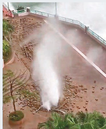
海水從凸起的地磚裂縫直噴而出。

香港文匯報訊(記者 杜法祖)臨海屋苑海怡半島，在「天鴿」襲港期間，海旁附近一帶路面有地磚凸起，海水由裂縫直噴出來，場面壯觀，途經人士紛紛走避遠離水柱，以免濕身。港鐵南港島線海怡半島站前晚亦因積水太深，需要臨時關閉，至昨日清晨始重新開放，惟站內部分商舖仍未恢復營業。