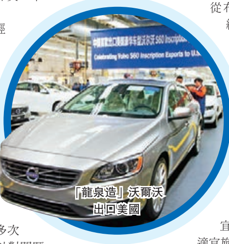
「龍泉造」沃爾沃 出口美國