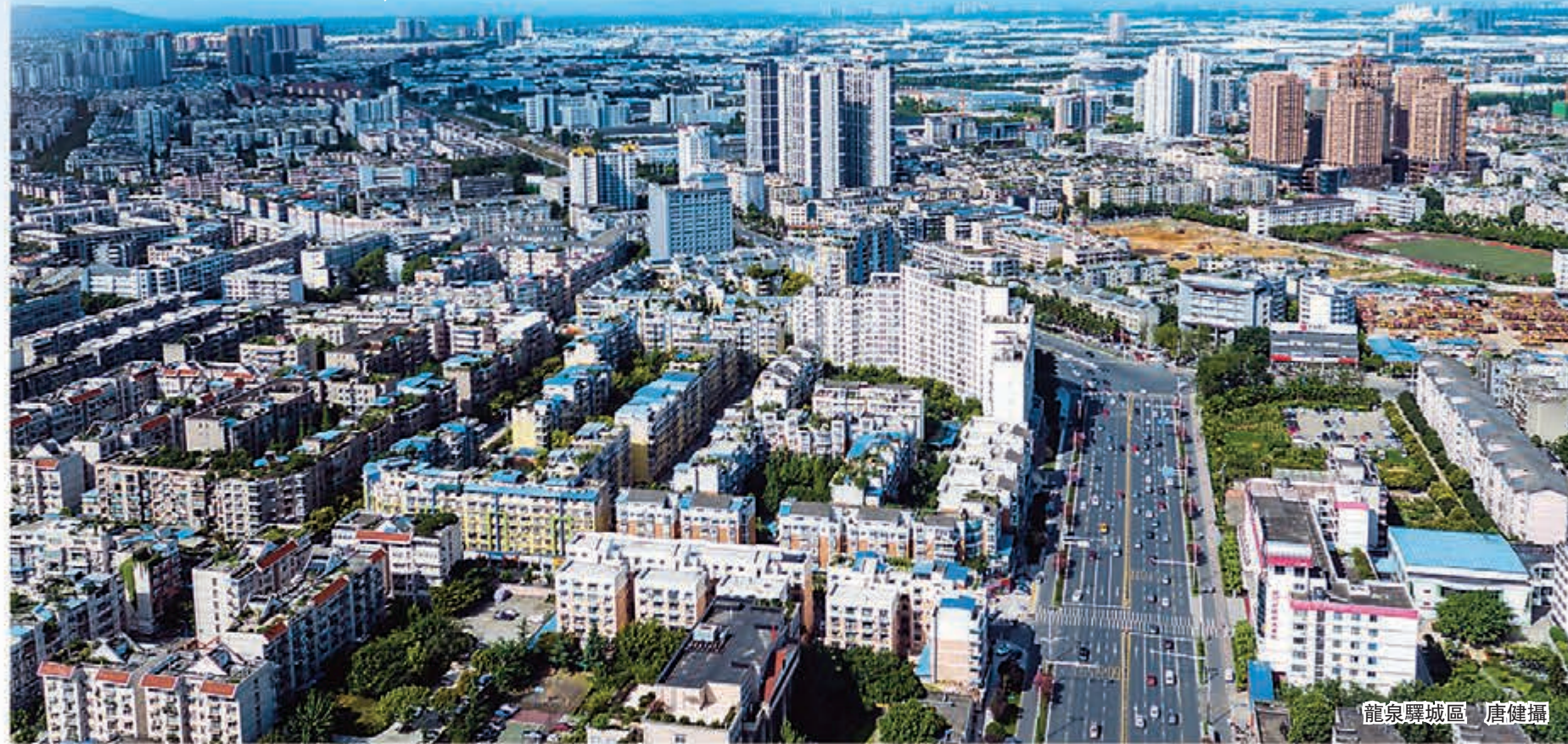
龍泉驛城區

躋身全國汽車產業集群「第二陣陣」。近年來,先後引進一汽大眾、一汽豐田、東風神龍、吉利、沃爾沃等11個整車(機)製造龍頭項目和一汽大眾發動機、富維江森等300餘個關鍵零部件項目,聚集了德國博世、美國德爾福等67家世界500強企業、上市公司57家。初步建立規模較大、體系較為完善、水平較高、品牌較多的汽車產業體系。2016