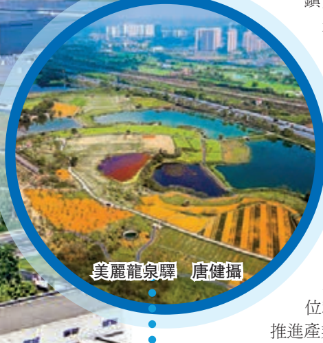
美麗龍泉驛