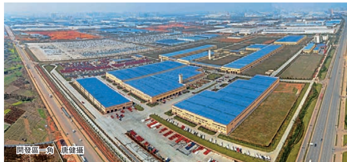
開發區一角

成都經開區(龍泉驛區)位於成都中心城區東部偏南、龍泉山脈中段,是連接成都至重慶、上海、廣西出海大通道的東部門戶要塞。距成都市中心10分鐘車程,距雙流國際機場、第二機場、亞洲最大的鐵路貨運編組站20分鐘車程,距重慶港、瀘州港2小時車程。貨物可以通過蓉歐快鐵直達歐洲。