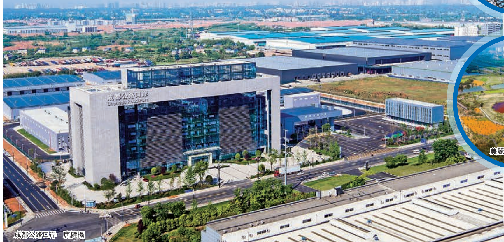
成都公路口岸