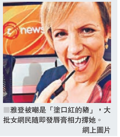
雅登被嘲是「塗口紅的豬」，大批女網民隨即發唇膏相力撐她。