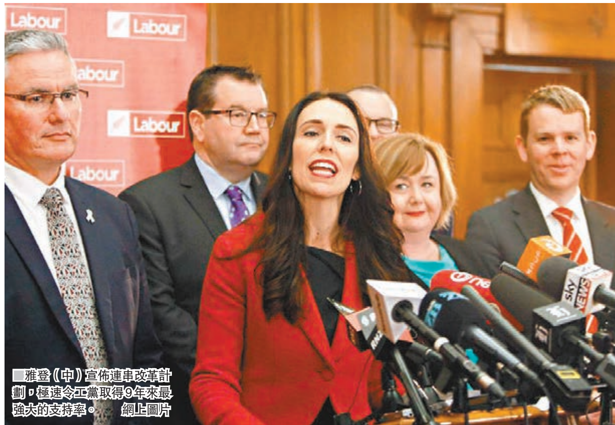
雅登(中)宣佈連串改革計劃，極速令工黨取得9年來最強大的支持率。