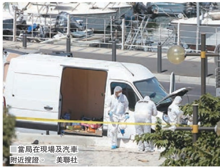
當局在現場及汽車附近搜證。