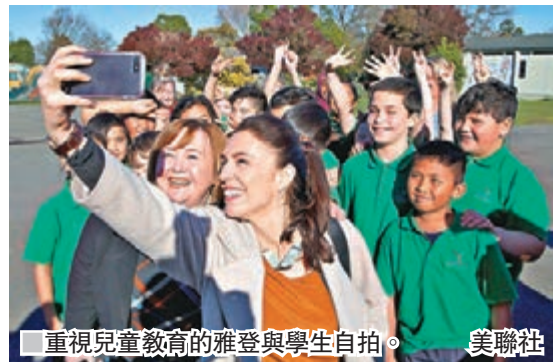
重視兒童教育的雅登與學生自拍。

37歲的新西蘭在野工黨黨魁雅登，2008年時僅28歲便當選國會議員，在黨內扶搖直上，被視為政治新星。同屬工黨的前女總理克拉克前日出席拉票活動時