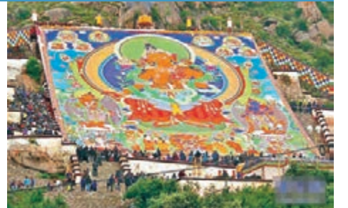
拉薩哲蚌寺昨日展佛儀式現場。

今年拉薩雪頓節於昨日(27日)舉行。據介紹，除展佛、藏戲表演、傳統馬術表演等傳統活動，此次「雪頓節」期間，還將舉辦