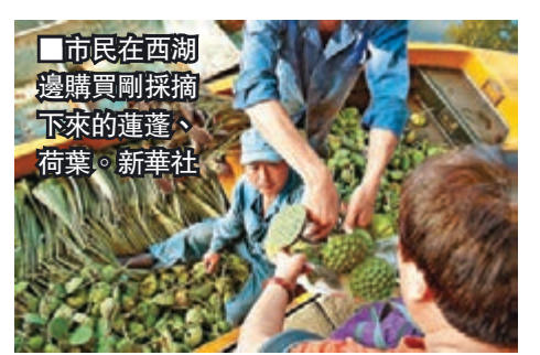
市民在西湖邊購買剛採摘下來的蓮蓬、荷葉。新華社

杭州西湖目前一共有10多處荷區，每到盛開時節，不僅嬌嫩欲滴的荷花備受海內外遊客喜愛，其「副產品」荷葉、蓮蓬更是受到熱捧。據杭州西湖水城管理處工作人員介紹，西湖荷花屬於「花蓮」品系，以觀賞為主，所以產量較小，往往「供不應求」。