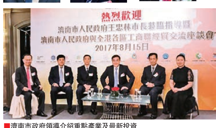
濟南市政府領導介紹重點產業及最新投資