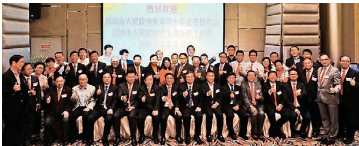
聊城市市長宋軍繼、中聯辦港島工作部副部長陳旭斌與全港各區工商聯會長董合照。