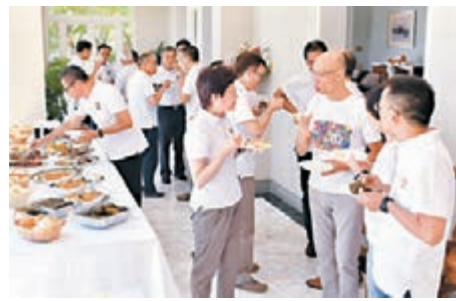
林鄭與高層官員舉行集思會。 卮圖片