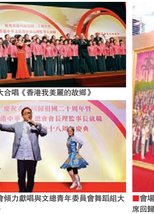
會場展出由畫家李青繪製的一幅2米乘5米的巨型油畫《龍騰香江》，以紀念國家主席習近平於今年在港出席回歸祖國20周年時的閱兵與遼寧號航母入港的重要時刻。