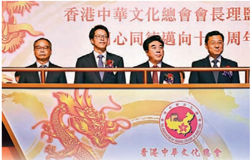
左起：劉江華、張曉明、高敬德及謝鋒。