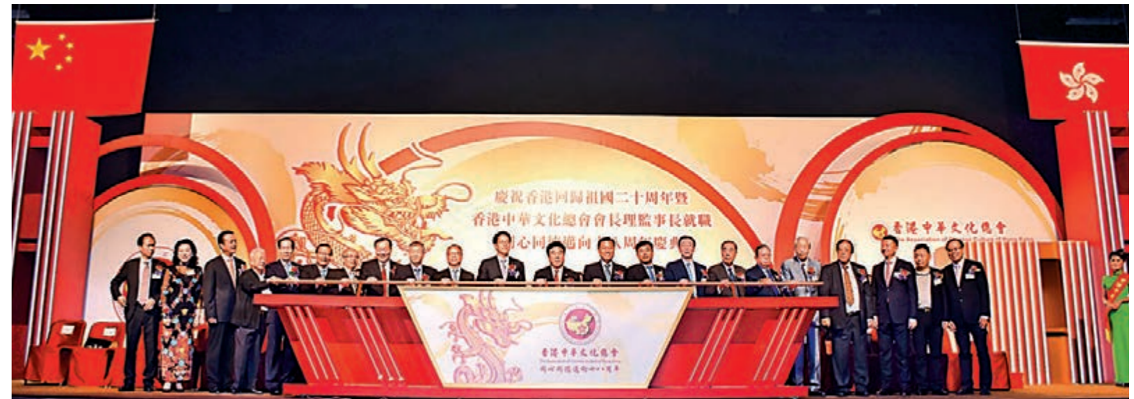
主禮嘉賓主持亮燈儀式