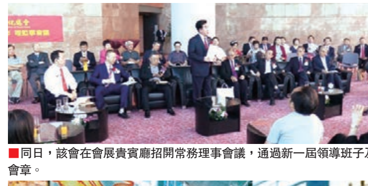
同日，該會在會展貴賓廳召開常務理事會議，通過新一屆領導班子及會章。