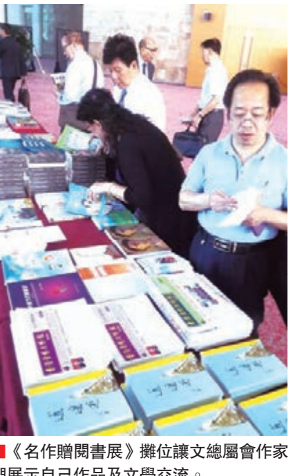
《名作贈閱書展》攤位讓文總屬會作家們展示自己作品及文學交流。