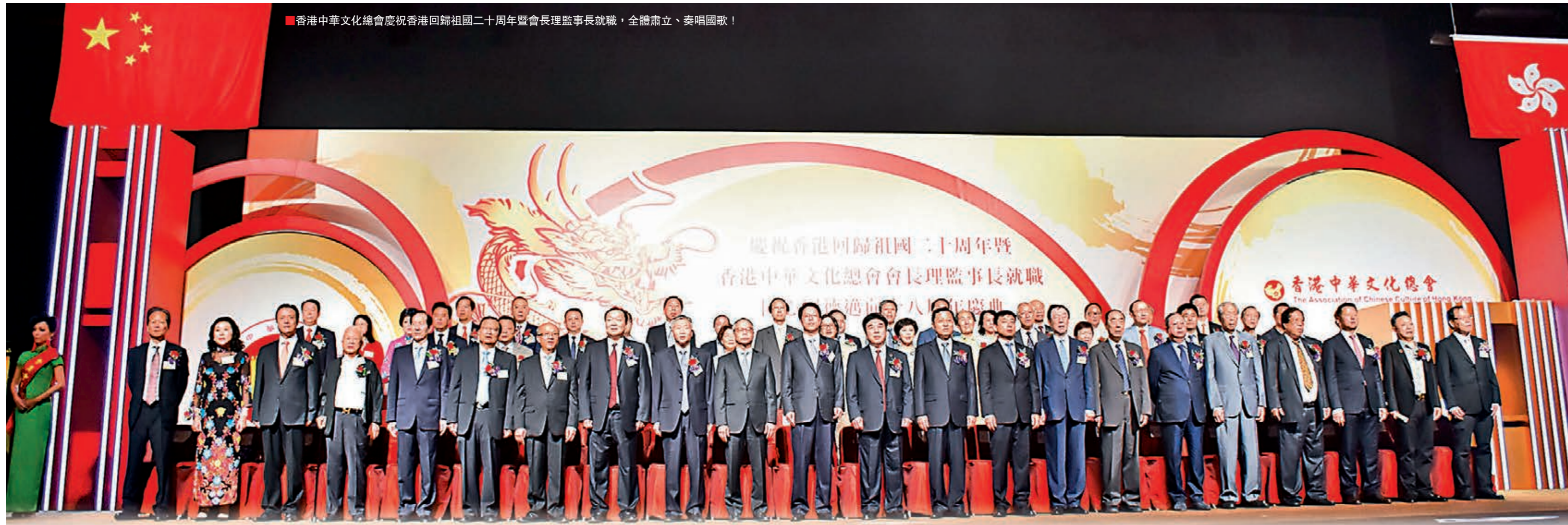
香港中華文化總會慶祝香港回歸祖國二十周年暨會長理監事長就職，全體肅立、奏唱國歌！