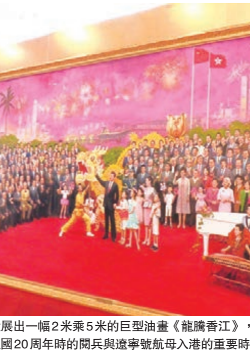
會場展出由畫家李青繪製的一幅2米乘5米的巨型油畫《龍騰香江》，以紀念國家主席習近平於今年在港出席回歸祖國20周年時的閱兵與遼寧號航母入港的重要時刻。