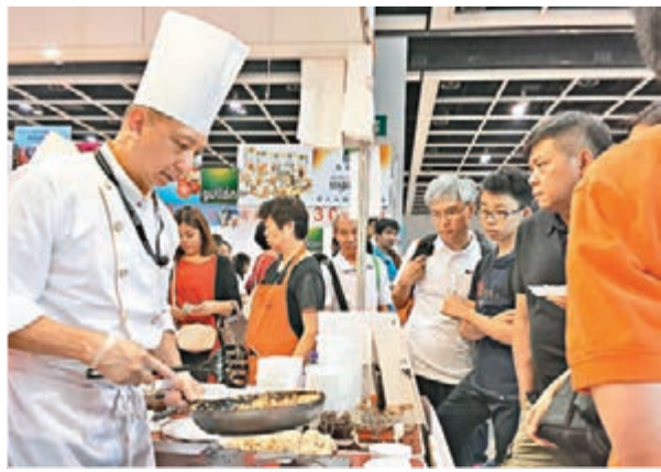
場內有不少試食區，更有展商請到行政主廚到場露兩手，吸引不少人圍觀。