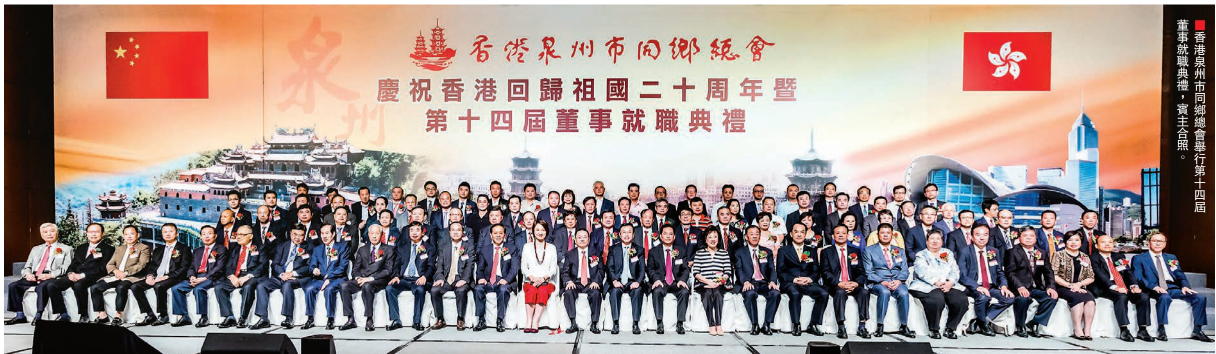
香港泉州市同鄉總會舉行第十四屆董事就職典禮，賓主合照。