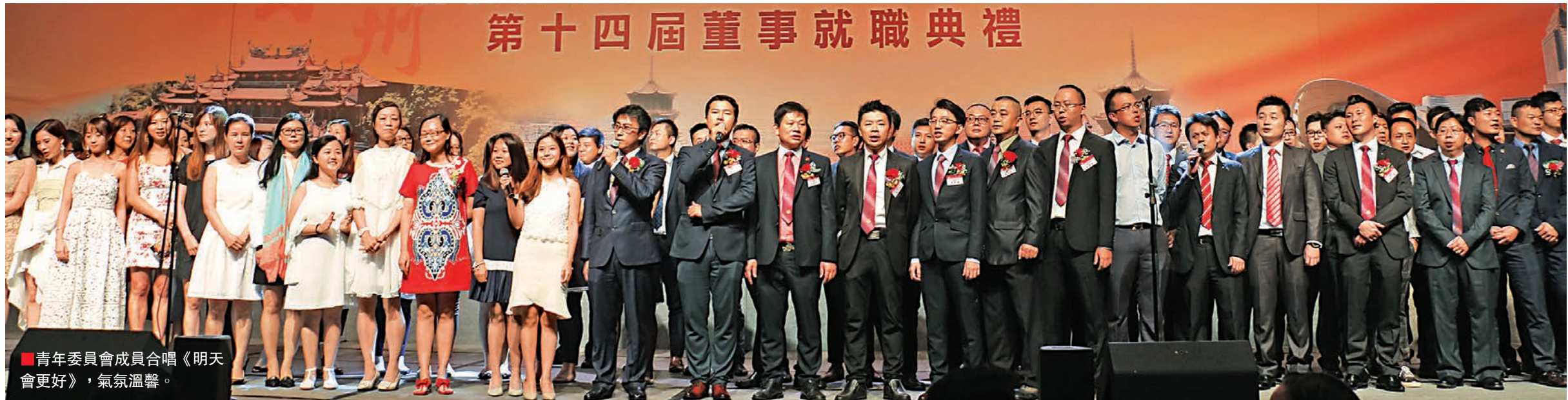
青年委員會成員合唱《明天會更好》，氣氛溫馨。