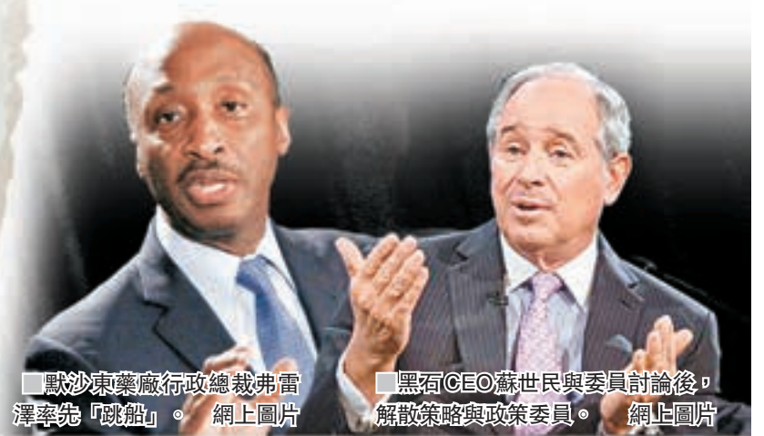
默沙東藥廠行政總裁弗雷澤率「跳船」。