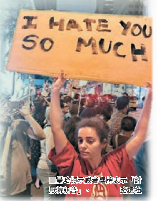
曼哈頓示威者舉牌表示「討厭特朗普」。路透社

最新公佈的民調顯示，特朗普的民望跌至上任以來最低的35%，多達72%受訪者認為他輕率魯莽，64%會因特朗普是總統而感到尷尬。由於這項民調在弗州暴力事件前進行，分析指他現在的支持度恐怕更低。 路透社/美聯社/法新社