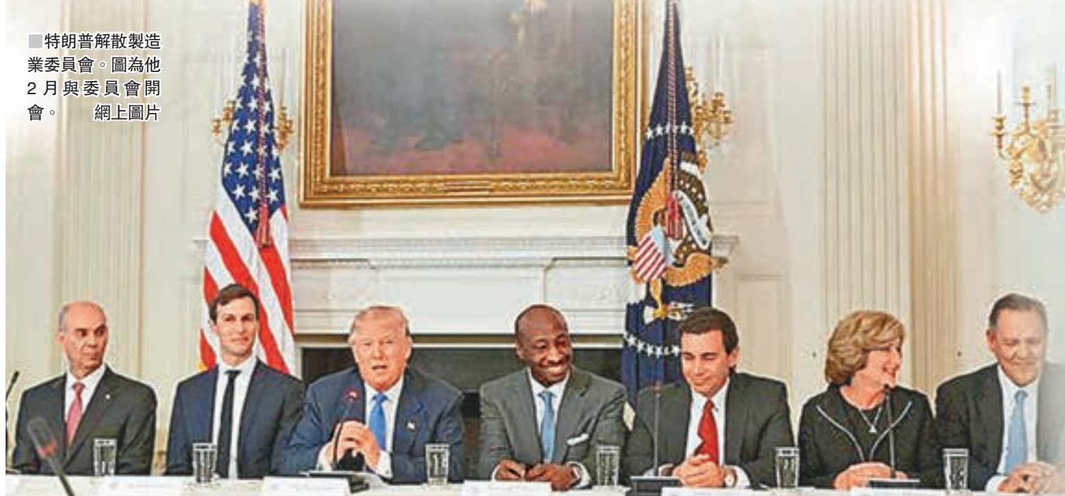
特朗普解散製造業委員會。圖為他2月與委員會開會。