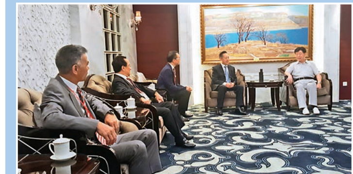
原山東省副省長謝玉堂(右)與考察團成員座談