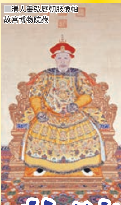
清人畫弘曆朝服像軸 故宮博物院藏

此外，還展出了乾隆五十二歲第三次南巡途中寫成的《閱海塘記》卷，他在卷中總結了從神禹至當時的治水理念及經驗教訓，並在實地考察杭州沿海塘壩的基礎上，闡明柴塘與石塘對於治理海患的不同作用與利弊得失。