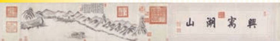
弘曆西湖圖卷 故宮博物院藏