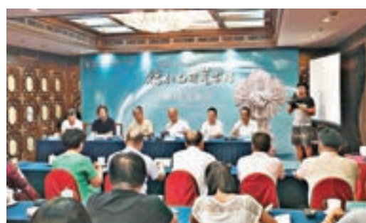
2017年國博德化白瓷藝術展發佈會現場。

記者日前在北京舉行的2017年國博德化白瓷藝術展發佈會上獲悉，展覽將於本月20日在中國國家博物館開幕，106位德化藝術家的181件陶瓷精品將與觀眾見面。另外，在9月1日的閉幕式上，將有一批大師作品入選國家博物館珍藏。據悉，德化陶瓷自宋代起就出口海外，被譽為「中國白」。目前，全球有40多個知名博物館將德化瓷作為「鎮館之寶」。