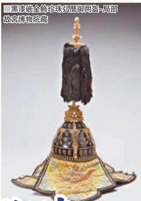
黑漆嵌金飾珠弘曆御用盔一局部 故宮博物院藏