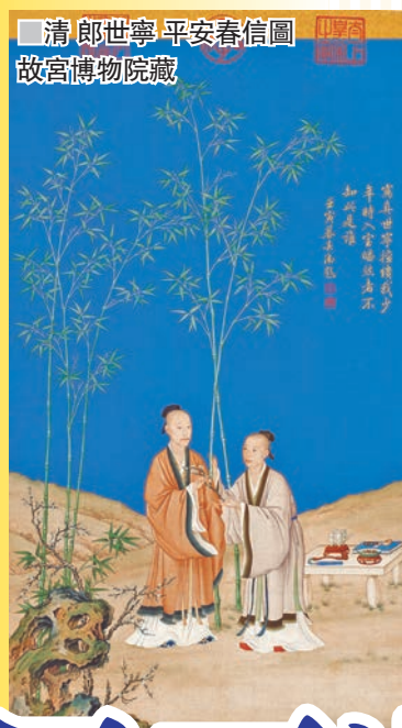
清 郎世寧 平安春信圖 故宮博物院藏