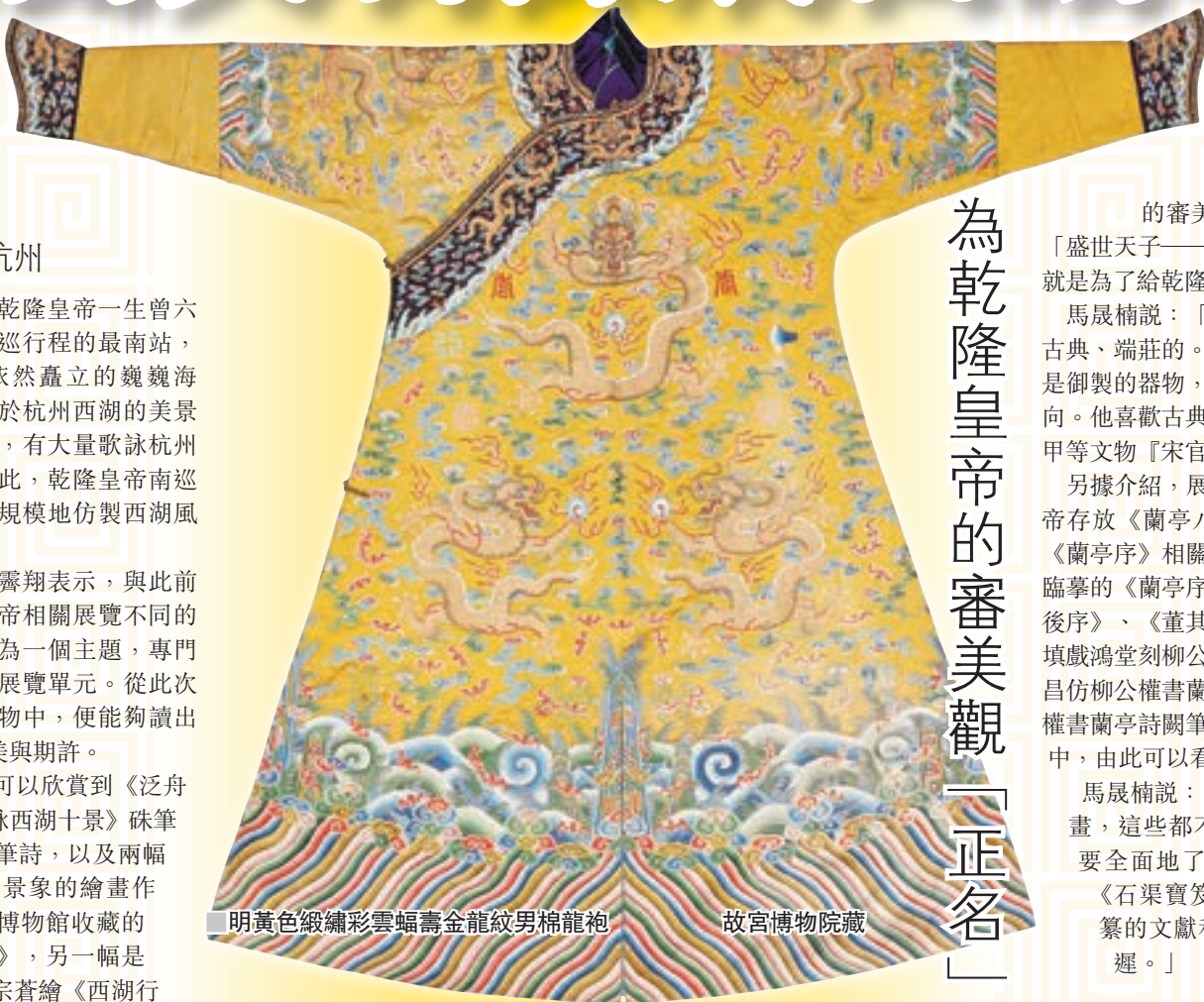
明黃色緞繡彩雲蝠壽金龍紋男棉龍袍 故宮博物院藏