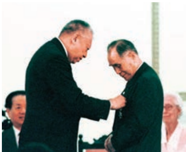
1997年7月2日，時任特區行政長官董建華授予莊世平大紫荊勳章。