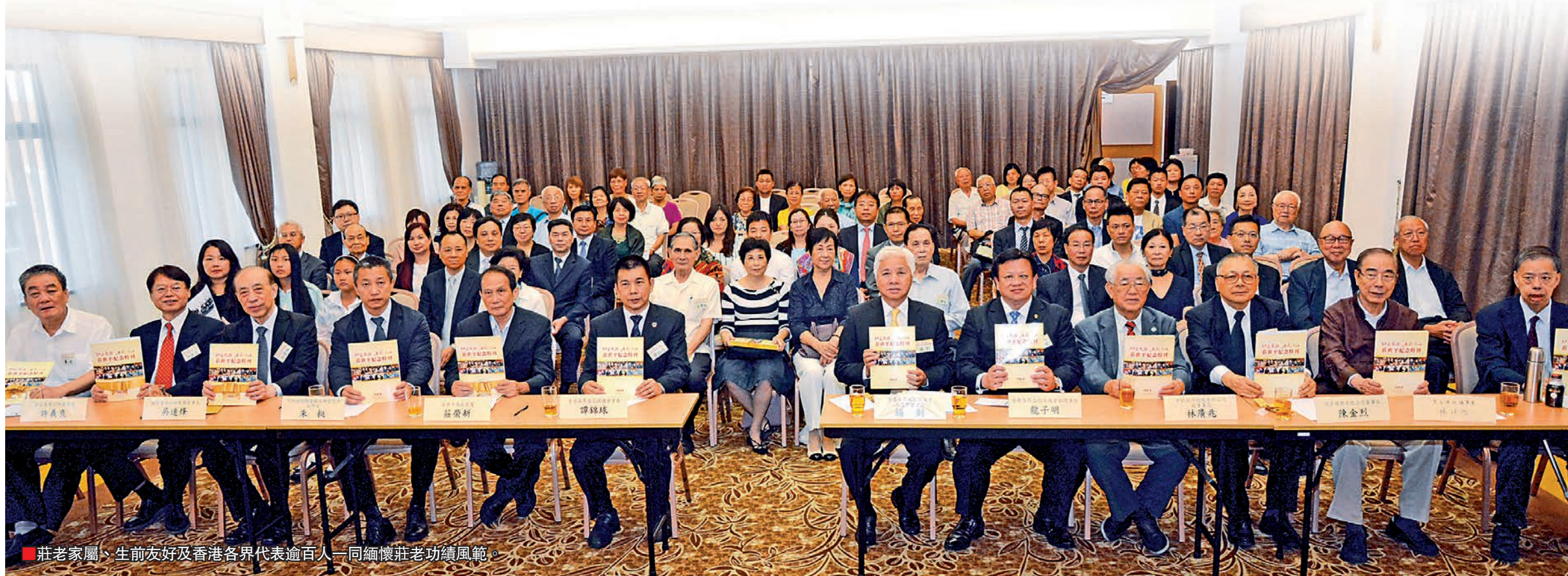
莊老家屬、生前友好及香港各界代表逾百人一同緬懷莊老功績風範。

今年是大紫荊勳賢莊世平逝世十周年。他在將近一個世紀的光輝奮鬥歷程中，每一步都與國家大局發展緊密相連。他一生為公，無私奉獻，鞠躬盡瘁，功在家國，垂範香江，深受歷任國家領導人和港人衷心敬重，被公認為愛國愛港的傑出典範。莊世平是香港各界文化促進會創會會長，2017年7月31日，文促會假座香港中華總商會大禮堂隆重舉辦「功在家國 垂範香江——莊世平先生逝世十周年紀念座談會」，逾百各界代表、莊老生前友好與家屬一起緬懷莊老一生風範。