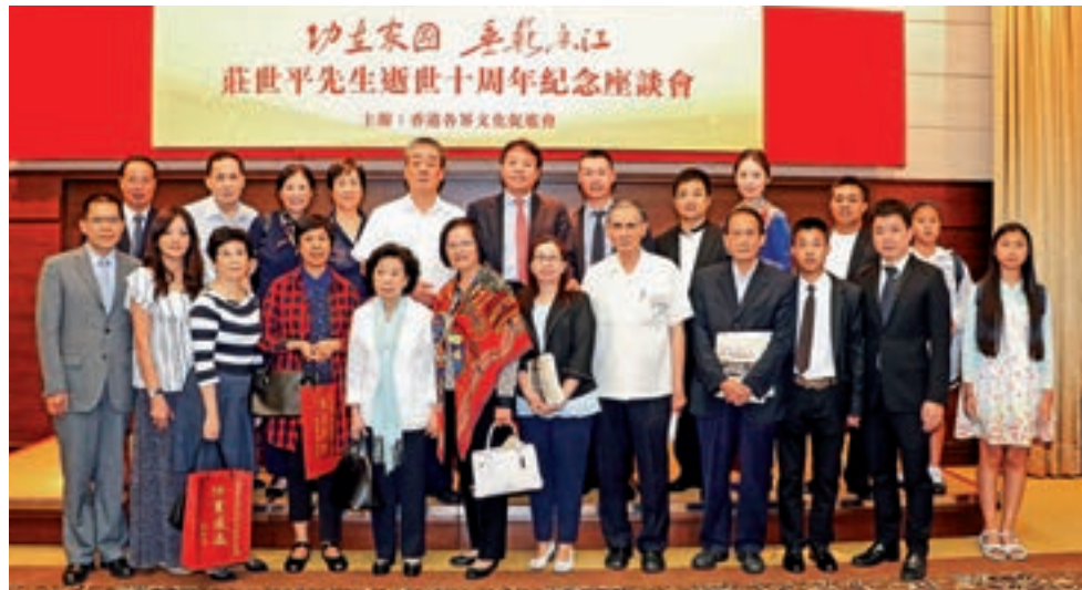
莊世平子女及多位家屬出席座談會。