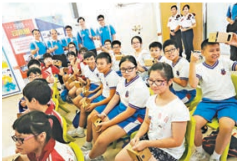
張建宗、區志光及劉業成主持少年警訊減罪夏令營開幕。

香港文匯報訊(實習記者 何玉瑩)少年警訊自1974年成立至今已43年,昨日更是第四十二屆少年警訊夏令營開幕的日子。為慶祝香港回歸20周年,本次夏令營亦特設多種設計獎項以及以「青年領袖,減罪伙伴;遵紀守法,尊重別人」為本年主題。昨日政務司司長張建宗、署理保安局局長區志光及署理警務處處長劉業成均到烏溪沙青年新村主持少年警訊減罪夏令營開幕典禮,更到訪多個工作坊,與少訊會員進行交流。