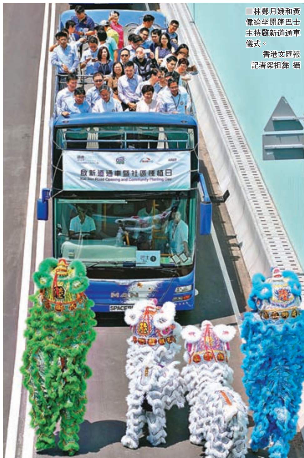
林鄭月娥和黃偉倫坐開篷巴士主持啟新道通車儀式。

現正在施工或即將開始的主要公共工程項目包括香港兒童醫院、啟德發展區內一段沙田至中環線、啟德明渠重建及改善工程、區域供冷系統一階段工程,以及各期大型基礎設施工程。