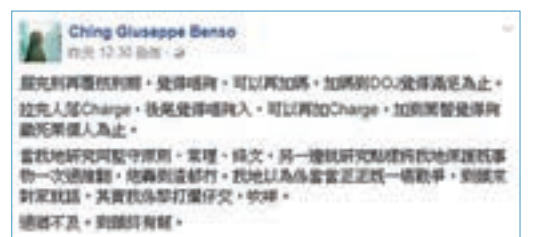
Cheap禎聲言政府只係打「爛仔交」。