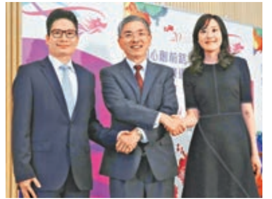
劉怡翔、陳浩濂及楊寶蓮。

香港文匯報訊(記者 周紹基)財經事務及庫務局副局長陳浩濂和政治助理楊寶蓮昨日履新,該局局長劉怡翔表示,好辛苦才找到兩位幫手,又指兩人對金融有認識,其中陳浩濂屬政黨出身,亦曾經出任區議員,日後會協助與立法會及政黨聯繫的工作,亦會主要負責金融科技、綠色金融、兩地融通及金融發展。至於楊寶蓮曾就金融問題有很多研究,具備語言和辯才,形容兩人是合適人選。