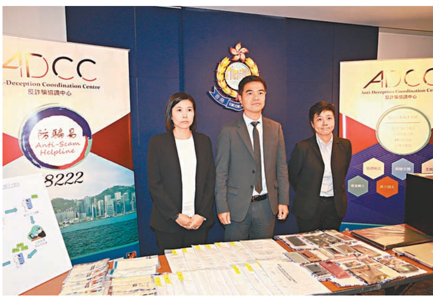
警方講述瓦解網上詐騙集團經過。

他呼籲市民在參與任何投資活動時，特別是年輕人要小心留意一些不合理的投資計劃，有懷疑應諮詢家人或專業人士意見，亦可致電18222向警方新成立的「反詐騙協調中心」查詢。