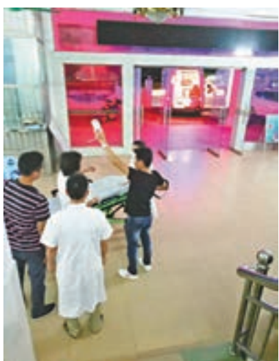
在惠東一酒店疑食物中毒的港人，即被送往當地醫院治療。

香港文匯報訊(記者 帥誠 廣州報導)近日，兩個香港旅行團84人在惠東雙月灣某酒店用餐後出現食物中毒反應，24人送醫治療，旅行團和酒店全程配合，工聯會工作人員趕赴醫院協助，感到不適的港人團友在病情穩定後於當晚返港作進一步治療。