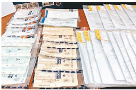
行動中檢獲大批虛假文件。