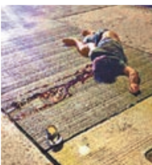
被的士輾過的南亞裔男子送院搶救不治。

香港文匯報訊(記者 蕭景源)尖沙咀昨晚深夜發生恐怖車禍，一名滿身酒氣的南亞裔男子在漆咸道南橫過馬路時，疑受酒精影響不支倒臥路中，其間雖有私家車司機察覺及時停車，惟隨後一輛的士疑收掣不及，輾過車主頭部，南亞漢當場重創流血昏迷，送院證實不治。警方不排除有人醉倒路中而慘遭橫禍，肇事司機事後涉嫌危險駕駛致他人死亡被捕。