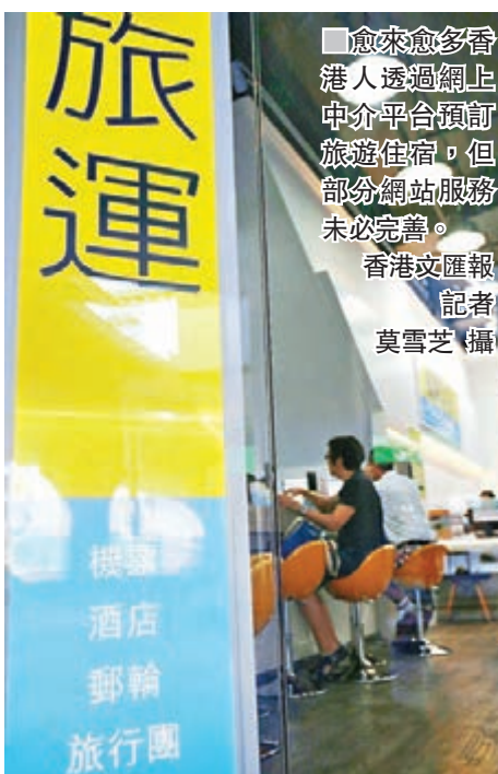
愈來愈多香港人透過網上中介平台預訂旅遊住宿,但部分網站服務未必完善。

消委會表示,不應盡信訂房網站所提供的酒店資料及評價,消費者應透過官方網站了解心儀酒店的具體資料,如酒店的正確位置、房間規格及房價。