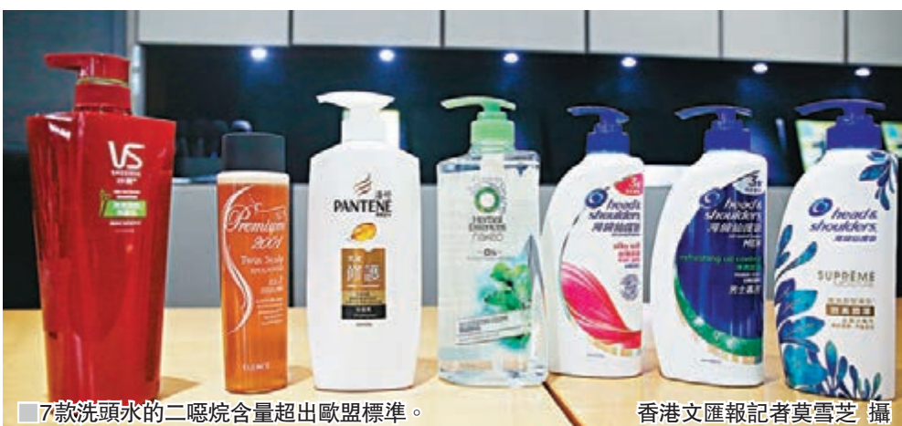
7款洗頭水的二噁烷含量超出歐盟標準。