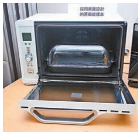
8款蒸焗爐樣本蒸煮速度相差35分鐘。

假設每日使用蒸焗爐煮食一次,以每度電1.2港元計算,使用蒸焗爐較傳統隔水蒸每年平均可省電費近124港元。消委會建議消費者使用蒸焗爐時,應留意蒸焗爐功率較高,建議獨立使用單一插座。