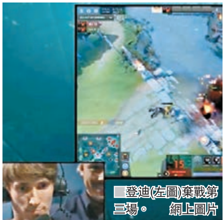
登迪(左圖)棄戰第三場。網上圖片