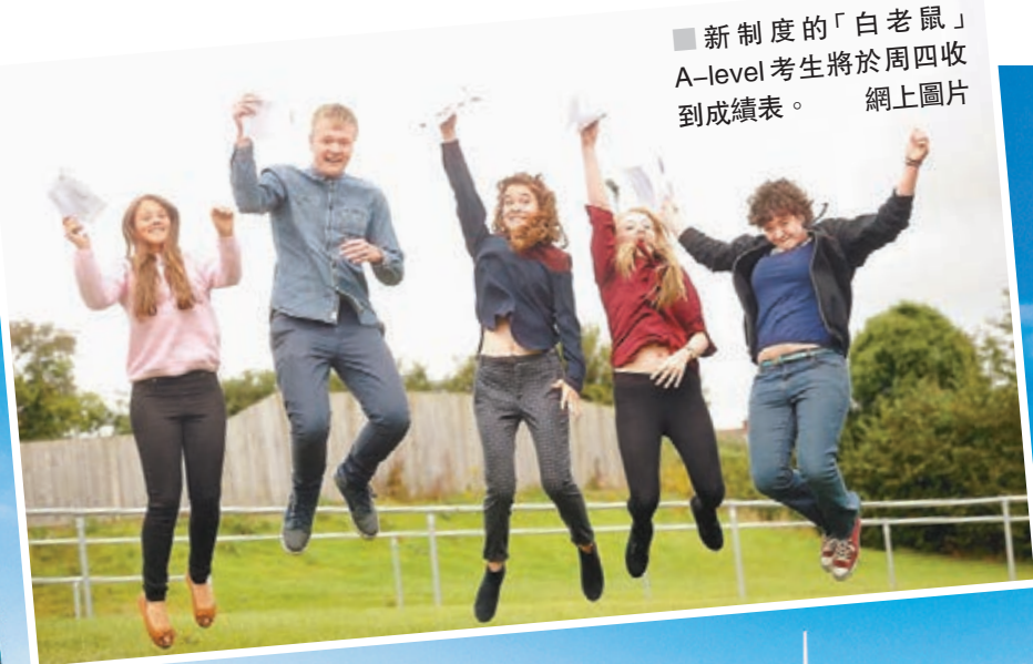
新制度的「白老鼠」A-level考生將於周四收到成績表。網上圖片

A-level課程為期兩年，舊制學生每年考一次試，總共考兩場，新制學生則在讀完課程後「一試定生死」。當局打算分3年循序漸進推行新制，首階段在2015年開始實施，牽涉13個科目，涵蓋文理科，課程內容及考試經重新設計，難度較以前高。第一批新制學生今年應考，人數超過20萬，他們沒有舊試題可以操練，亦無從得知新的評分標準。部分大學憂慮，大量申請者可能無法考獲預計成績，最終要進入補招程序。