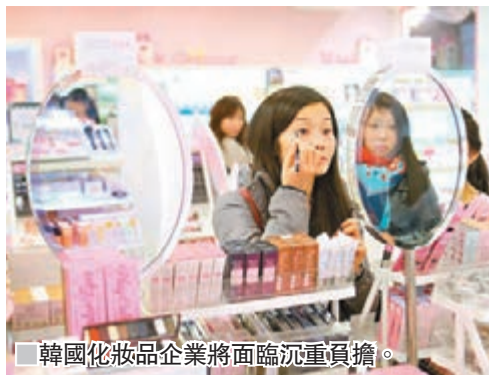
韓國化妝品企業將面臨沉重負擔。

旨在保護生物多樣性的《名古屋議定書》，將於周四在韓國正式生效，當中規定企業在生產化妝品過程中，須向輸入生物原料的國家支付「利益共享」費用。由於韓國化妝品大量使用進口生物資源，估計每年需額外支付1.5萬億韓元(約103億港幣)費用，導致進口成本上升，該國生產的護膚品和化妝品恐因此漲價。 不論植物、動物、昆蟲、微生物、細菌、種子或DNA(脫氧核糖核酸)，