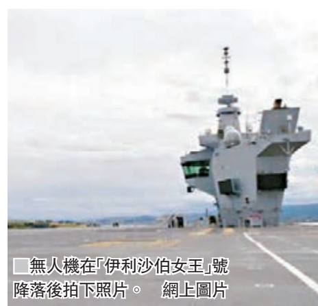
無人機在「伊利沙伯女王」號降落後拍下照片。

用作出檢討。國防部發言人稱非常重視航母安全，事發後已加強保安措施，蘇格蘭警方正調查事件。