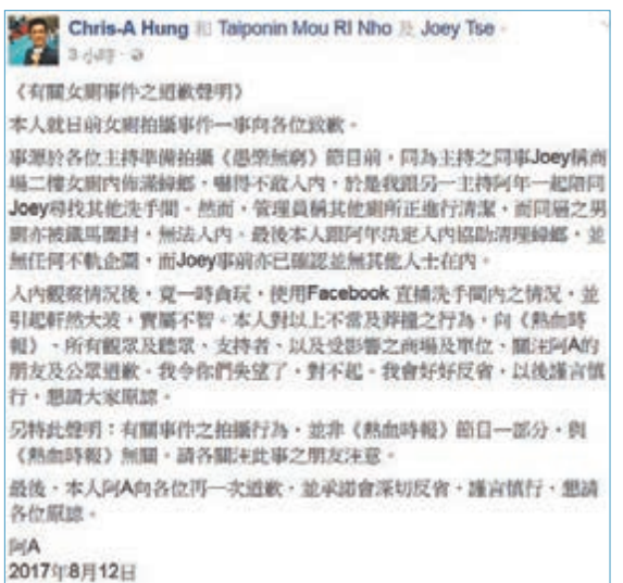
事件主角在fb公開道歉。