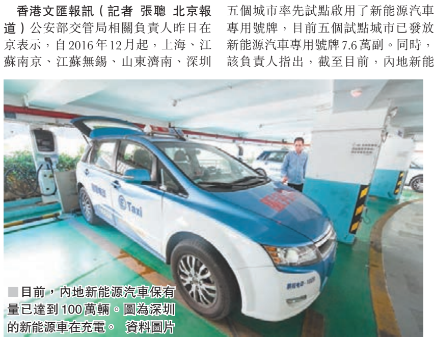
■ 目前，內地新能源汽車保有量已達到100萬輛。圖為深圳的新能源車在充電。

香港文匯報訊(記者 張聰 北京報道)公安部交管局相關負責人昨日在京表示，自2016年12月起，上海、江蘇南京、江蘇無錫、山東濟南、深圳五個城市率先試點啟用了新能源汽車專用號牌，目前五個試點城市已發放新能源汽車專用號牌7.6萬副。同時，該負責人指出，截至目前，內地新能源汽車保有量已達到100萬輛，為進一步擴大改革受益面，公安部在總結試點經驗的基礎上，決定於2018年上半年在全國範圍內推廣應用新能源汽車專用號牌。 據介紹，為更好實施國家新能源汽車產業發展及差異化管理政策，新能源汽車專用號牌按照不同車輛類型實行分段管理。小型新能源汽車會在號牌的第一位使用字母，而大型新能源汽車專用號牌則在最後一位使用字母，目前啟用的字母為D和F，D代表純電動新能源汽車，F代表非純電動新能源汽車。 該負責人指出，推廣應用新能源號牌，一方面，可以更有效、更便捷區分辨識新能源汽車，實施差異化交通管理政策，為新能源汽車通行便利等提供更好的載體。另一方面，可以更鮮明、更直接體現新能源汽車特點，推動新能源汽車加快發展。