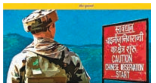
Army Moves Troops of Sukna-Based 33 Corps to India-China Border

據印度 The Quint 網站當地時間8月9日報道，駐蘇克納(Sukna)的印軍第33軍大批部隊已經或正在向中印邊境錫金段集結。網上圖片