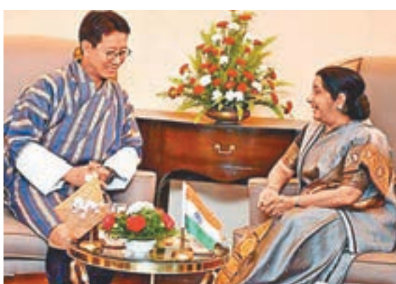
■ 印度外長斯瓦拉傑8月11日在加德滿都會見了不丹外長多吉(左)。

報道稱，與會期間，斯瓦拉傑還說道，「睦鄰優先」和「東進」政策是印度外交政策的優先內容，對於印度推行其關鍵性的外交政策而言，BIMSTEC 是一個天然的選擇。