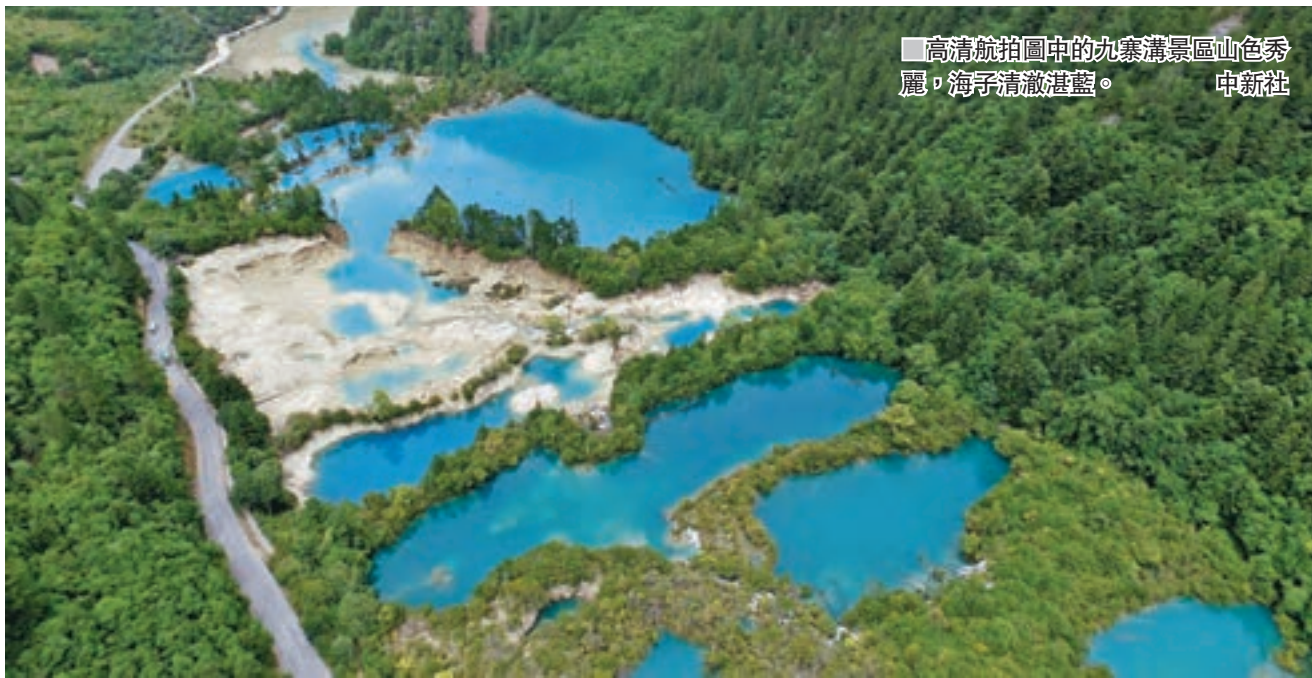
■ 高清图中的九寨溝景區山色秀麗，海子清澈湛藍。

香港文匯報訊 四川省九寨溝7.0級地震截至昨日已經過去四天了，仍有6名失聯人員，緊張的救援仍在進行之中。作為海內外知名的旅遊景區，素有人間仙境之稱的九寨溝，經過這次地震之後，多個景點受損，這是否會影響到整個景區的景觀面貌，也備受外界關注。國家旅遊局官方微信賬號和《中國新聞周刊》昨日分別刊發了大量地震後所拍攝的照片。從6,000米高空俯瞰，九寨溝依然美麗，連綿的青山秀麗依舊，散落的海子清亮的眸子，有的延綿相接，有的獨立成潭，依然幽藍清澈。另據四川省政府新聞辦消息，九寨溝景區火花海以上的景觀，並無重大損壞。