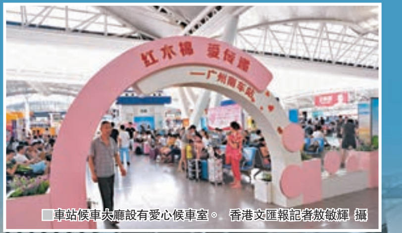
車站候車大廳設有愛心候車室。