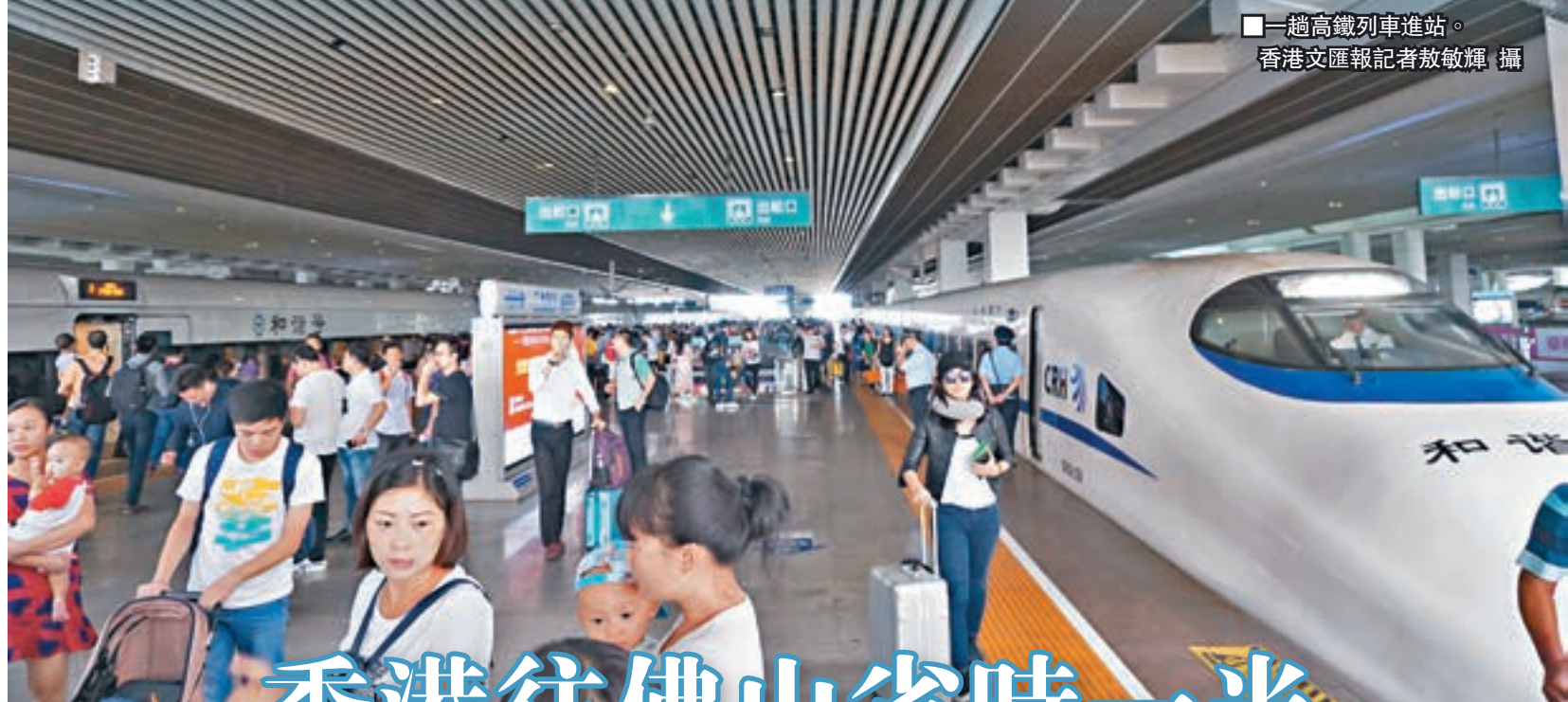
一趟高鐵路列車進站。