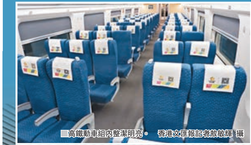
高鐵動車組內整潔明亮。