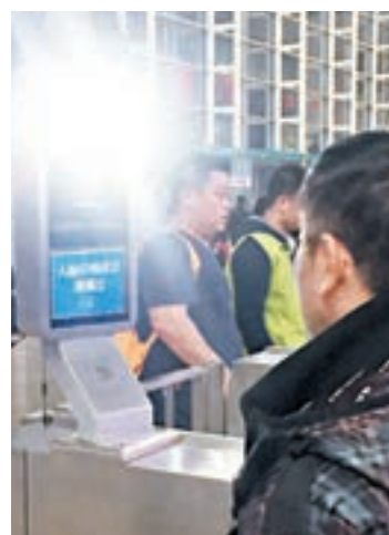
人臉識別進站。

務台，可提供快遞和寄存服務。在候車室，記者看到車站新增了充電樁，免費為旅客提供充電服務。