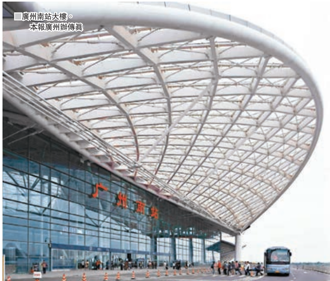
廣州南站大樓。本報廣州辦傳真

反對派聲稱，廣深港高鐵「最遠」只可以到廣州南站，又形容南站是「山旮旯」（偏遠）地方。類似的說法，其實是故意無視高鐵的價值在於其四通八達的「網絡」。廣州南站是華南高鐵第一樞紐，目前每日開行動車組接近800車次，遠超北京西站和上海虹橋站，成為全國最為高效的高鐵站。如今，從廣州南站乘車可通達珠三角，同時，隨着近日廣州至蘭州G96次高鐵的開通，北上可直達全國20個省會城市。同時，從該站出發，可實現中途不出站換乘抵達內地任何一個擁有高鐵路的城市。廣深港高鐵路全線通車後，廣州南站將是港人前往珠三角及進一步北上最便捷的到發車站。