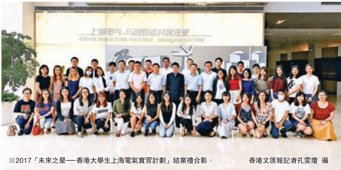
2017「未來之星——香港大學生上海電氣實習計劃」結業禮合影。