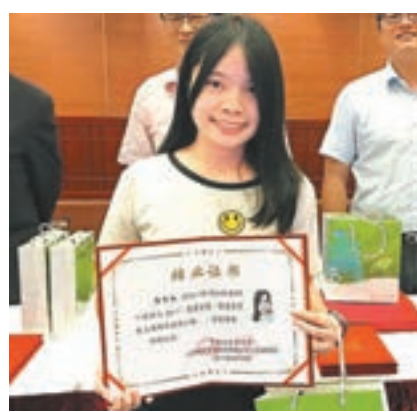
港生向記者展示實習結業證書。

術宮、田子坊、豫園、上海中心等地標。不少學生認為，之前只是聽說上海很繁華，這次親臨其中才首次體會到內地快速的發展，看着路上步伐匆忙的人群，熙熙攘攘的商店，繁華程度完全不比香港的中環、銅鑼灣遜色，風土人情則別有一番風味。