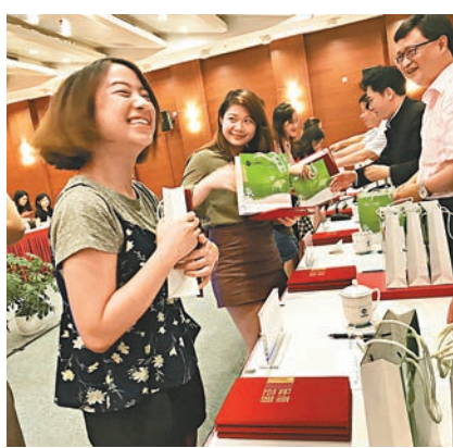
港生拿到證書一刻，難掩心中喜悅和激動。