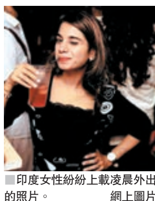
■ 印度女性紛紛上載凌晨外出的照片。網上圖片