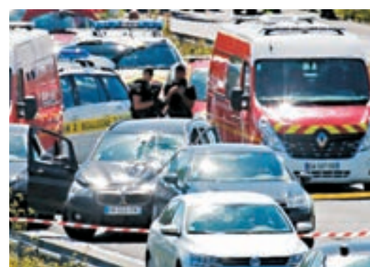
■ 涉案寶馬車窗碎裂，警員在附近戒備。

法國昨日再發生懷疑針對軍人的襲擊，一輛汽車清晨在巴黎西北部近郊一個軍營附近，撞向一批士兵，造成6名士兵受傷，當中3人重傷。警方事後在巴黎北面一條公路上，開槍截停撞人車輛，並拘捕懷疑涉及襲擊的30多歲司機。暫時未知襲擊動機，反恐部門已經介入調查。