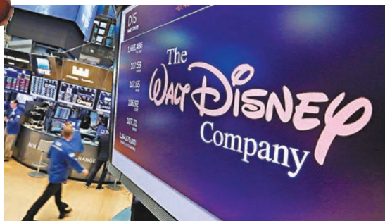
■ 迪士尼2019年將終止向Netflix(下圖)提供彼思及迪士尼電影播放權。