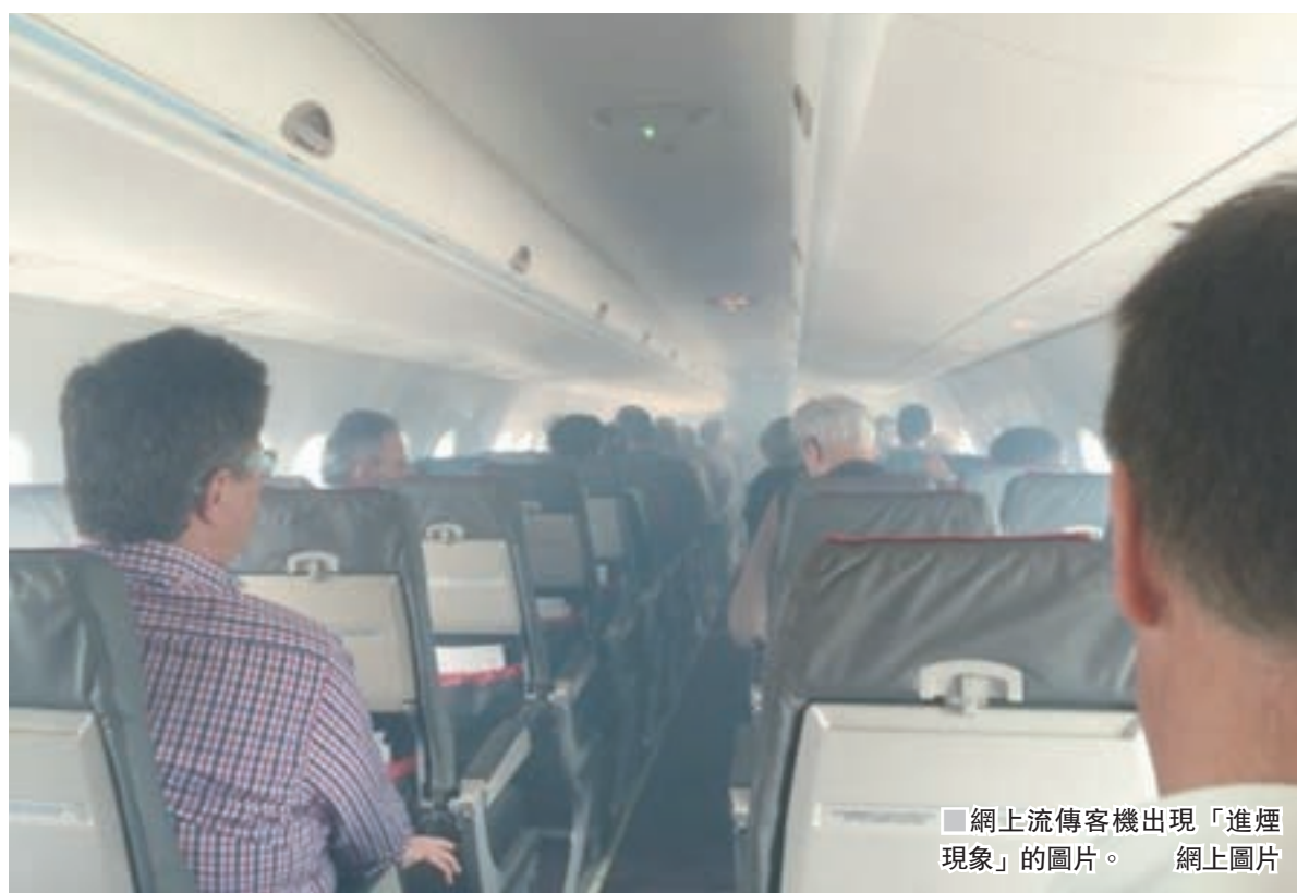
■ 網上流傳客機出現「進煙現象」的圖片。