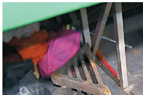
旅巴司機偷渠蓋被捕。電視截圖

香港文匯報訊（記者 蕭景源）一名旅遊巴士司機疑為搵快錢，竟駕車到沙田一地盤路旁，極速偷走路邊4個渠蓋，警方翻查地盤天眼鎖定疑人及旅遊巴士，相信有人食髓知味會再犯案，前晚埋伏現場守候，其間果見目標旅巴再駛至有所行動，探員立即現身截查，在旅巴上起回4個失竊渠蓋，涉案司機盜竊罪被拘捕拘查。