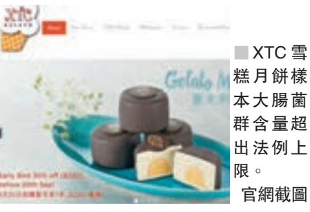
XTC雪糕月餅樣本大腸菌群含量超出法例上限。

發言人續稱，大腸菌群含量超出法例標準，顯示產品的衛生情況不理想，並不表示會引起食物中毒，中心會繼續跟進事件和採