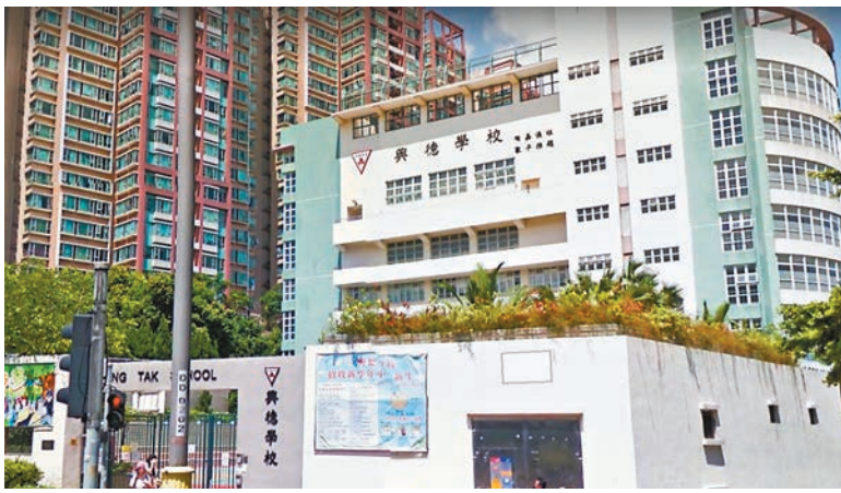
屯門興德校涉「影子學生」，已交警方處理。資料圖片

興德學校的校政及管理醜聞不絕，除警方日前已開始調查該校一宗有關聘用校長助理的偽造文件案外，就該校缺席一整年但仍然能升班的「影子學生」問題，教育局昨日亦確認，已將相關資料轉交警方處理。有由教育局委任整頓該校管治的校董透露，校內對立問題嚴重，除有10多名老師不滿校長發起抗議外，亦有多名教師及家長聯署，高調表明不歡迎該批老師；而早前的校董會會議，更出現校長「現身」但稱病假當缺席論的荒誕情況，最終人數不足流會收場。 香港文匯報記者 溫仲綺