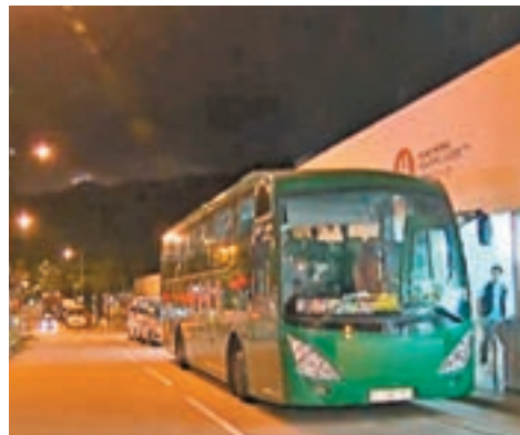
旅巴折返失竊現場被截獲。電視截圖