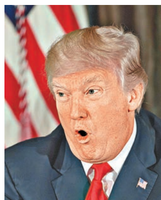
特朗普以最強硬態度警告朝鮮，被指靠嚇。

門發言時，美國的軍事優勢壓倒日本，日本當時也未擁有核武。然而，特朗普恐嚇的對象屢次試射洲際彈道導彈，亦在全力研發核武。 肯尼迪溫和處理冷戰危機 史學家貝施奇洛施認為，歷屆總統每當回應危機，發言時普遍用字溫和，避免局勢惡化。冷戰期間，美國揭發蘇聯在古巴秘密建造導彈發射井，觸發古巴導彈危機，前總統肯尼迪1962年發表演說，他隔空向蘇聯領導人赫魯曉夫喊話，呼籲對方立即停止威脅世界和平，「穩定兩國關係，切勿讓世界掉進毀滅的深淵」。 曾任前總統布什國家安全委