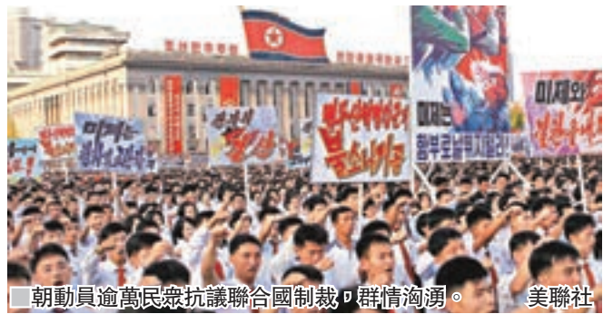
朝動員逾萬民眾抗議聯合國制裁，群情洶湧。