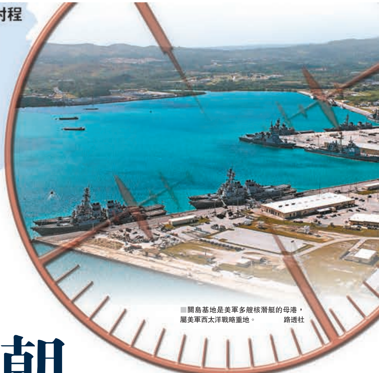
關島基地是美軍多艘核潛艇的母港，屬美軍西太平洋戰略重地。

朝鮮和美國對峙態勢升級，美國總統特朗普前日向朝鮮發出最強硬的警告，揚言假如朝鮮繼續挑釁，就會以「前所未見的怒火」還以顏色。朝鮮也不甘示弱，聲稱計劃動用中遠程彈道導彈，攻擊美國太平洋軍事重地關島，只要最高領導人金正恩一聲令下，軍方就能隨時行動。美國情報官員透露，朝鮮已成功研製可安裝在導彈上的小型核彈頭。