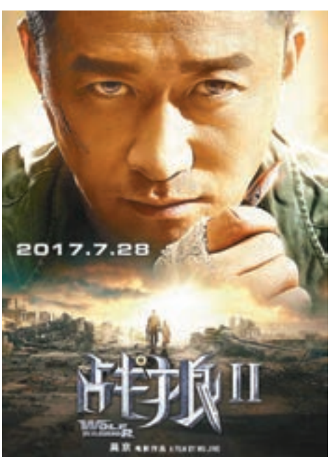
《戰狼2》相關概念股在漲勢後出現降溫。

巨豐投顧則指,進入8月份市場震盪需求升級,尤其是周期股連續續升,3,300點未能突破的情況下,短期應注意市場隨時的大震盪。