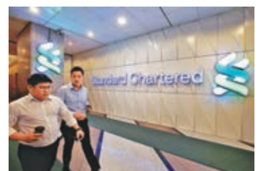
渣打銀行認為內地經濟增長態勢穩健，今年實現6.5%左右的全年經濟增長目標「可以比較安心」。資料圖片

不過，如何讓這一「暖風」惠及中小企業依然有待解決。最新發佈的渣打中小企業信心指數顯示，7月份新出口訂單指標進一步降低至52.5。融資難、兌付風險高、信用證接收難等因素限制了內地中小企業在非洲等「一帶一路」沿線地區進一步拓展業務。丁爽則指出，此前大量資金在金融領域中空轉推升了資金成本，許多中小企業因此難以從銀行獲得貸款。隨着去槓桿持續推進，長遠來看相關現象將得到改善。