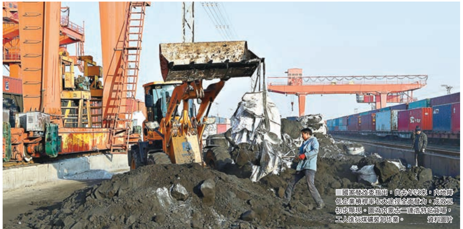
國家發改委指出，自去年以來，內地降低企業槓桿率七大途徑全面發力，成效已初步顯現。圖為內蒙古二連浩特站貨場，工人進行煤礦裝卸作業。

同時，在3.4萬家享受優惠政策的企業中，選擇減稅降費的企業比例為44.6%。國家統計局建議，下一步應繼續把強實體作為關鍵舉措，在降成本、拓寬融資渠道、簡化審批流程等方面釋放更多的政策紅利，以使企業在生產經營中的痛點難點更少，獲得感更多。