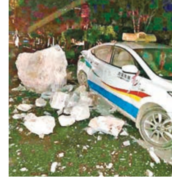
在九寨溝地震中受損的出租車。

此外，四川省地震局、甘肅省地震局、青海省地震局、陝西省地震局、寧夏自治區地震局、四川省阿壩州地震局及有關縣級地震部門迅速派出人員開展災情調查和現場應急工作。中國地震局地震現場應急工作組赴四川協助地方政府開展抗震救災工作。中國國家救援隊也已做好出隊準備。