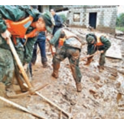
四川普格縣昨日發生泥石流，事件已造成24人死亡1人失聯。

普格縣位於四川省涼山州東南部，幅員面積1,918平方公里，是一個以彝族為主體的少數民族聚居縣、國家扶貧開發工作重點縣、典型的農業縣。