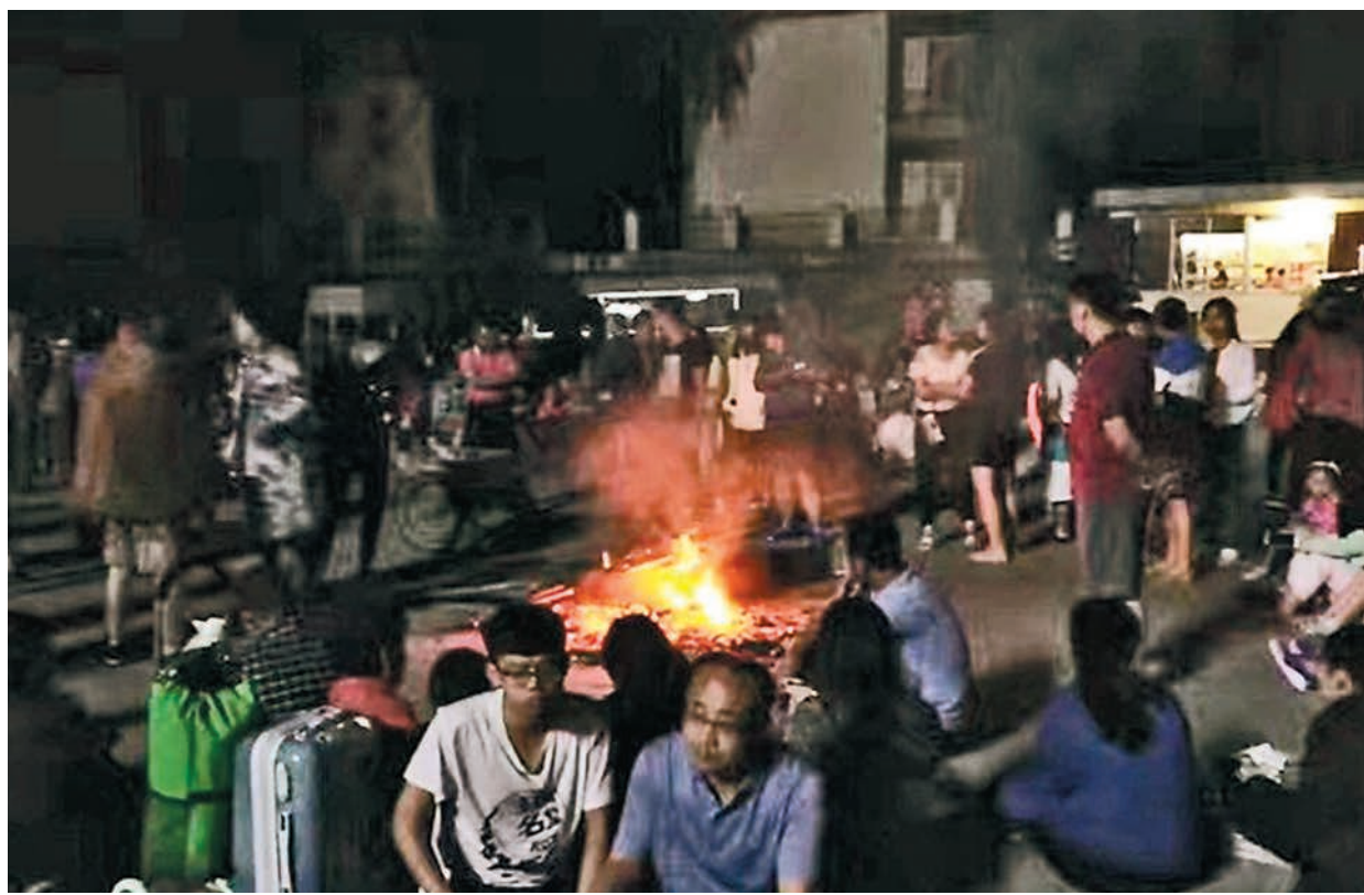
中國地震台網測定8月8日21時19分，四川阿壩藏族自治州九寨溝縣發生7.0級地震，震源深度20公里。地震後，當地居民以及來到九寨溝旅遊的遊客帶著行李箱來到大街上，生起篝火取暖。網上圖片