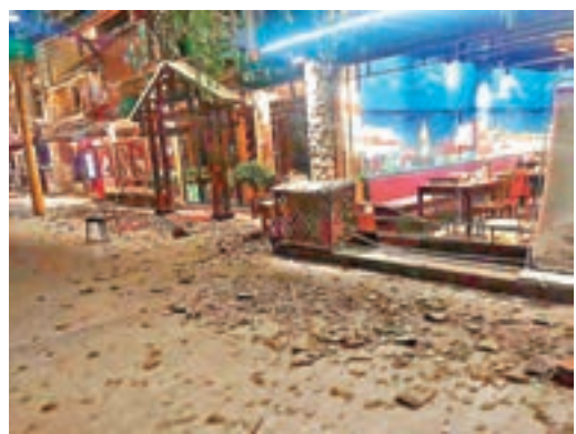
九寨溝景區遊客中心附近因地震受損的街區。

央視網的報道顯示，甘肅、陝西、重慶、山西、河南、寧夏、青海等省份都有震感。陝西西安不少網友都迅速在新浪微博上傳當地民眾疏散照片，指「有強烈的感覺」。