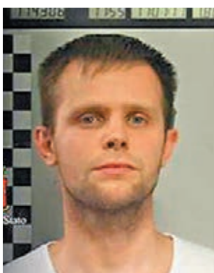
赫巴聲稱他所隸屬的網上組織規定不可綁架已為人母的女性。

英國一名 20 歲女模特兒上月被誘騙到意大利米蘭拍攝照片，遭一名 30 歲波蘭男子綁架，疑犯要求其經理人或家人繳付 30 萬歐元 (約 276.2 萬港元) 贖金，否則將將模特兒在暗網 (即黑市交易網站) 當作性奴拍賣。不過疑犯約一週後向受害者表示，由於她是育有一名年輕孩子的母親，而綁架母親違反他屬組織的規定，故釋放對方。他翌日遭警方拘捕，當局正追捕其同黨。