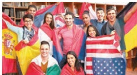
海外學生只須完成由私人公司開辦的課程，就可入讀英國大學。

英國有超過 25 萬考生正等待下周四的高級程度會考 (A-level) 放榜日，成績將影響升學之路。《星期日泰晤士報》就發現，牛津、劍橋等名牌大學近年增收海外學生，英國本地學生比例大跌，個別大學更給予海外生特別優待，即使他們未持有與 A-level 同等的學術資格，只須完成由私人公司開辦的課程就可入學。曾掌管教育部門的阿多尼斯狠批精英大學將本地生拒諸門外，背叛大學的使命。