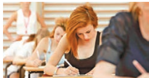
英國超過 25 萬考生正等待下周四的 A-level 放榜日，成績將影響升學之路。

《星期日泰晤士報》比較 2008 至 2009 年度及 2015 至 2016 年度的數據，發現有「英國常春藤聯盟」之稱的「羅素大學集團」轄下 24 間大學中，其中 12 間修讀學士課程的本地生人數下跌，非歐盟學生數量則上升。然而，本地入學申請期間增加了 8.5 萬宗。調查顯示牛津大學增收了 51% 非歐盟學生，減收 12.6% 本地生，劍橋大學則大削本地生近 29%。