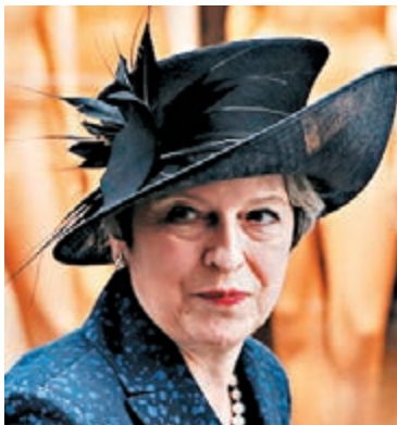
文翠珊願支付 300 億歐元以上分手費，以打破脫歐談判僵局。

脫歐分手費一直是英國與歐盟之間的談判重點，英方一直未有說明願意付出多少。《星期日電訊報》昨報道，英國政府擬向歐盟支付最多 400 億歐元 (約 3,682 億港元) 分手費，以打破脫歐談判僵局，換取對方同意就貿易協議展開磋商。