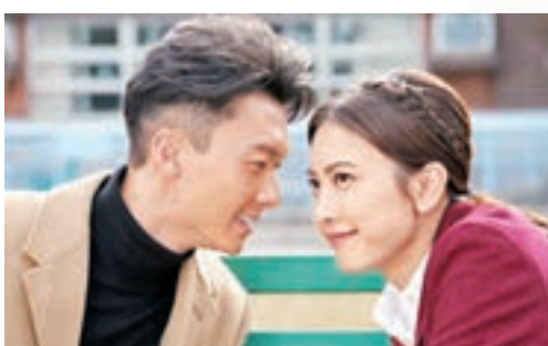
■ 有指《踩過界》的結局相當「洋葱」。劇照

對於《踩過界》因與內地網站合作，令大結局劇情曝光，對此浩信表示任何媒體播出有關片段和之後的劇情都會明白，當然一班演員辛苦拍劇是希望勾起觀眾收看大結局，對於大家有機會看到這些片段甚至非法看