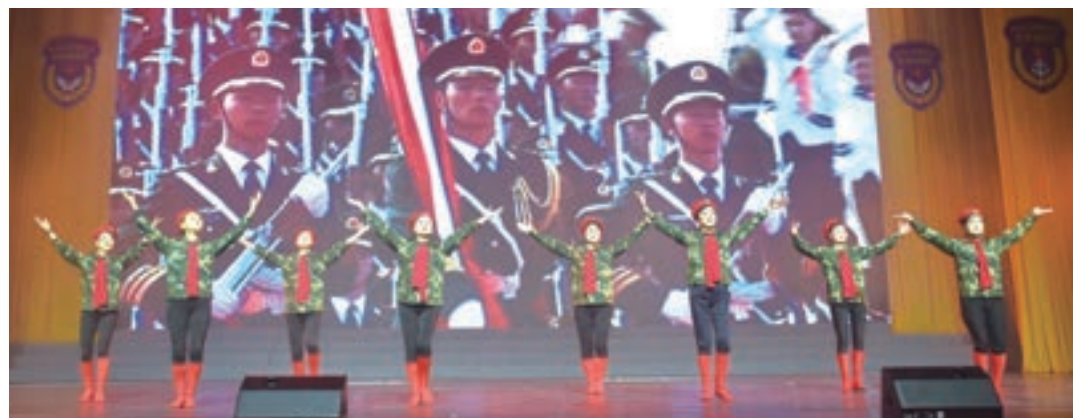
香港福建婦女協會舞蹈隊演出舞蹈《走向復興》