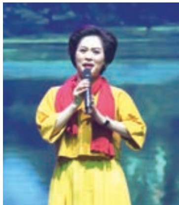
陳麗華演唱歌曲《蘆花》