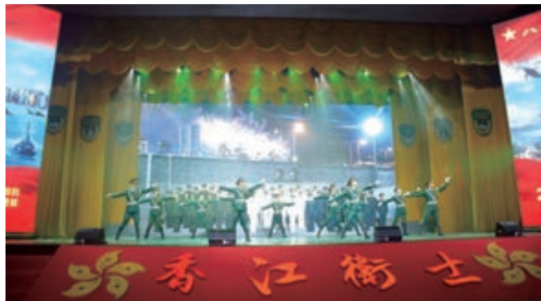
駐港部隊演出歌舞《香江衛士》