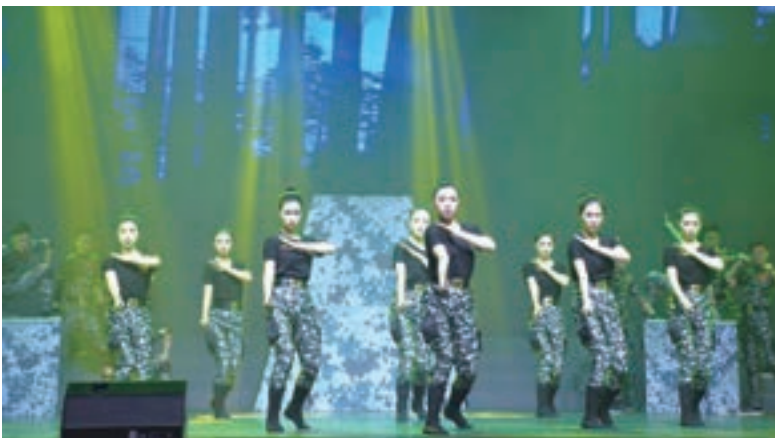
駐港部隊演出舞蹈《特戰出擊》