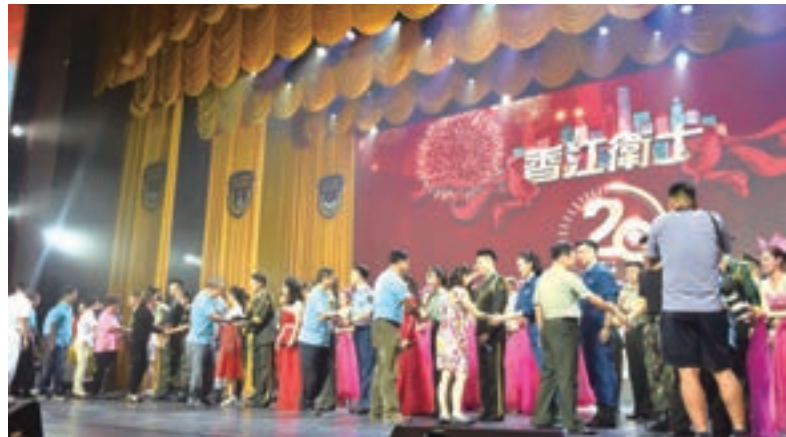
福建同鄉會以及福建婦女協會代表們紛紛上台與表演者握手致謝