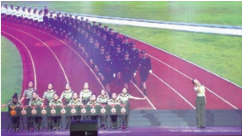
駐港部隊表演歌舞《心得體會》