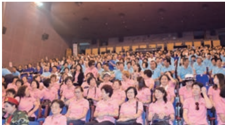
演出現場座無虛席，場面熱鬧。