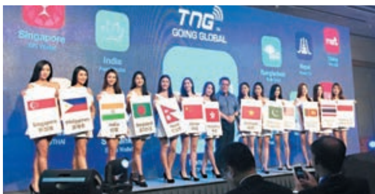
■TNG即將於本週完成A輪融資。

香港文匯報訊(記者 吳婉玲)外電引述消息指，香港電子錢包營運商TNG即將於本週完成A輪融資，目標估值約5億美元(約39億港元)。彭博社報道指，該公司已經吸引近6,000萬美元投資，投資者包括北京的私