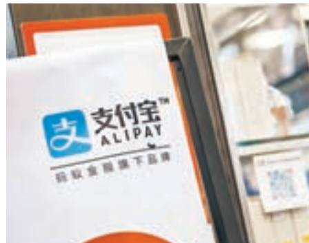
■開雲集團同意撤銷向阿里巴巴及螞蟻金服支付寶發起的訴訟。

香港文匯報訊 法國奢侈品集團開雲集團與阿里巴巴集團及其關聯企業螞蟻金服集團達成協議。各方將共同開展知識產權保護，於線下發起針對侵權者的聯合行動，致力於為消費者提供卓越體驗和可信賴的環境。協議中，開雲集團已同意撤銷在紐約地區法院向阿里巴巴集團及螞蟻金服集團子公司支付寶發起的訴訟。