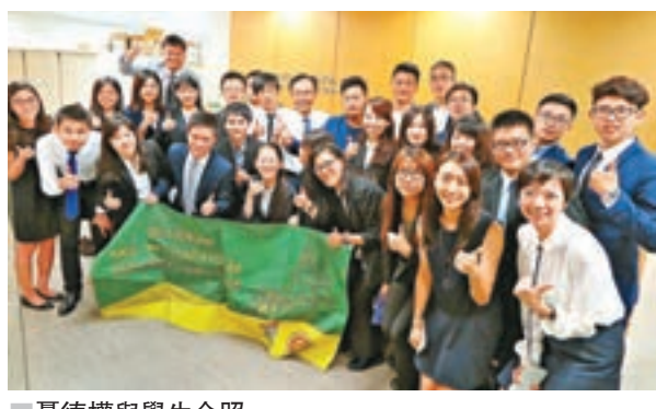
聶德權與學生合照。

香港文匯報訊(記者 鄭治祖)為配合行政長官林鄭月娥提出，加強與年輕人接觸及互動，政制及內地事務局局長聶德權繼早前到訪荃灣區，與區議員及年輕人會面之後，昨日再與一班參與「青年視野——北大港大學生交流論壇」的香港和內地學生會面，並鼓勵香港和內地的年輕人，應加強彼此的交流和合作，藉着互相交流的過程中學習，從而增進大家的了解，以期能夠合力為國家的發展作出貢獻。聶德權於活動上指出，這些交流活動模式非常之有意義。他又說，隨着粵港澳大灣區發展規劃的開展，將為廣東、香港和澳門以至國家開拓新的發展空間，同時更為香港和內地的青年人，帶來不少的發展機會及空間。聶德權更勉勵一眾年輕人，須積極把握這個難得的機遇，在促進自身發展之餘，也為國家的建設貢獻力量。該論壇由香港大學和北京大學聯合主辦，香港大學學生會國事學會承辦，目的是推動兩地青年學生互动交流、互相學習，加深大家的了解和認識。