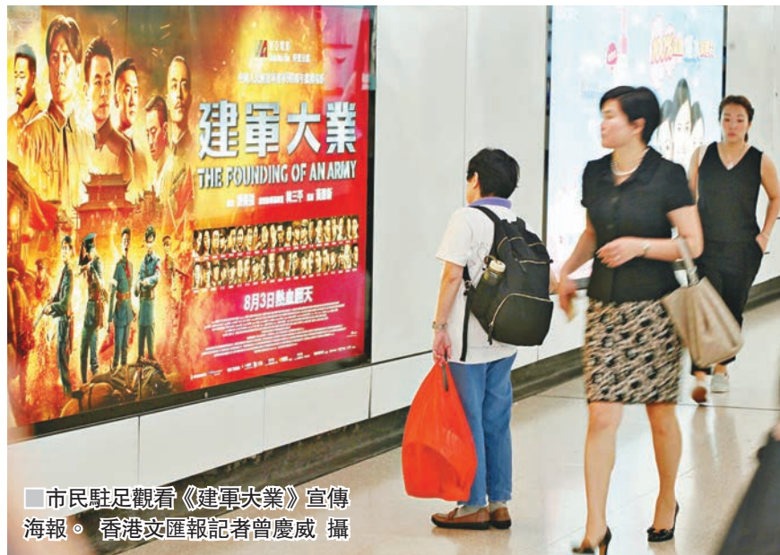
市民駐足觀看《建軍大業》宣傳海報。

香港文匯報訊（記者 殷翔、實習記者 林浩賢）作為慶祝中國人民解放軍建軍90周年獻禮大片，《建軍大業》昨日在港各大影院上映，港島、九龍、新界共29間影院首日座上座理想，觀眾反應熱烈。影片中，建軍元勳們為救助水深火熱中的勞苦大眾、為建立強大新中國，不惜拋頭顱灑熱血、奮勇獻身，感動全城。有曾親身參與建軍大業軍人的女兒，專程入場觀看，感動得熱淚盈眶，盛讚影片十分寫實、還原歷史。觀眾們感歎國家興盛，有賴強大軍隊保障，國家強大來之不易，港人有責任有義務捍衛國家統一、堅決反對分裂。他們還紛紛表示要向子女推薦這部好電影，讓年輕一代了解國家歷史，承傳先烈精神。