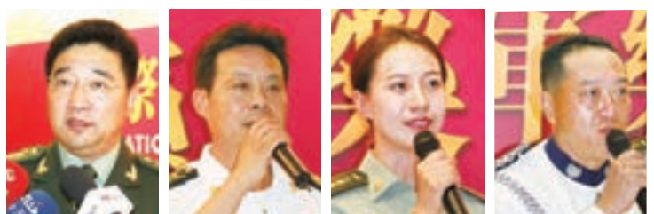
中國人民解放軍軍樂團團長鄒銳、中國人民解放軍海軍軍樂團團長林海峰、中國人民解放軍三軍儀仗隊女兵中隊長程誠、香港警察樂隊音樂總監梁寶根

容納上萬名觀眾的香港紅磡體育館座無虛席，這次演出不僅可以促進各軍樂團交流，還能讓香港觀眾認識和欣賞來自世界各地不同音樂的風格和特色。