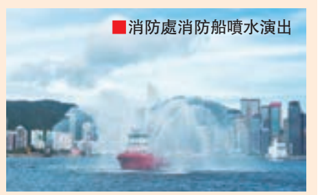
消防處消防船噴水演出

「國際軍樂匯演」戶外嘉年華亦於早前在香港文化中心露天廣場舉行，有不同的精彩表演，節目包括政府飛行服務隊直昇機檢閱飛行、消防船射水表演、本地紀律部隊步操巡遊、海外軍樂團演出、民安隊少年團花式單車表演、紀律部隊工作犬示範演出等。豐富節目包括攤位遊戲和訪港軍樂團及本地紀律部隊代表的演出，吸引了一家大小的市民到來。嘉年華安排有有趣刺激的活動包括射擊遊戲「神勇追擊