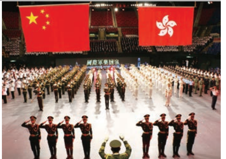
「國際軍樂匯演」於7月13-15日在香港體育館舉行