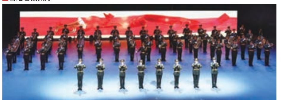
中國人民解放軍軍樂團