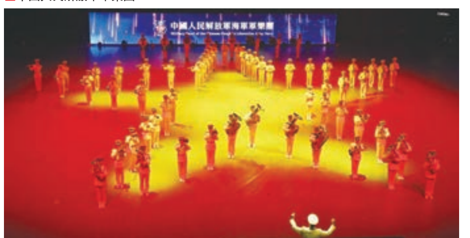
中國人民解放軍海軍軍樂團