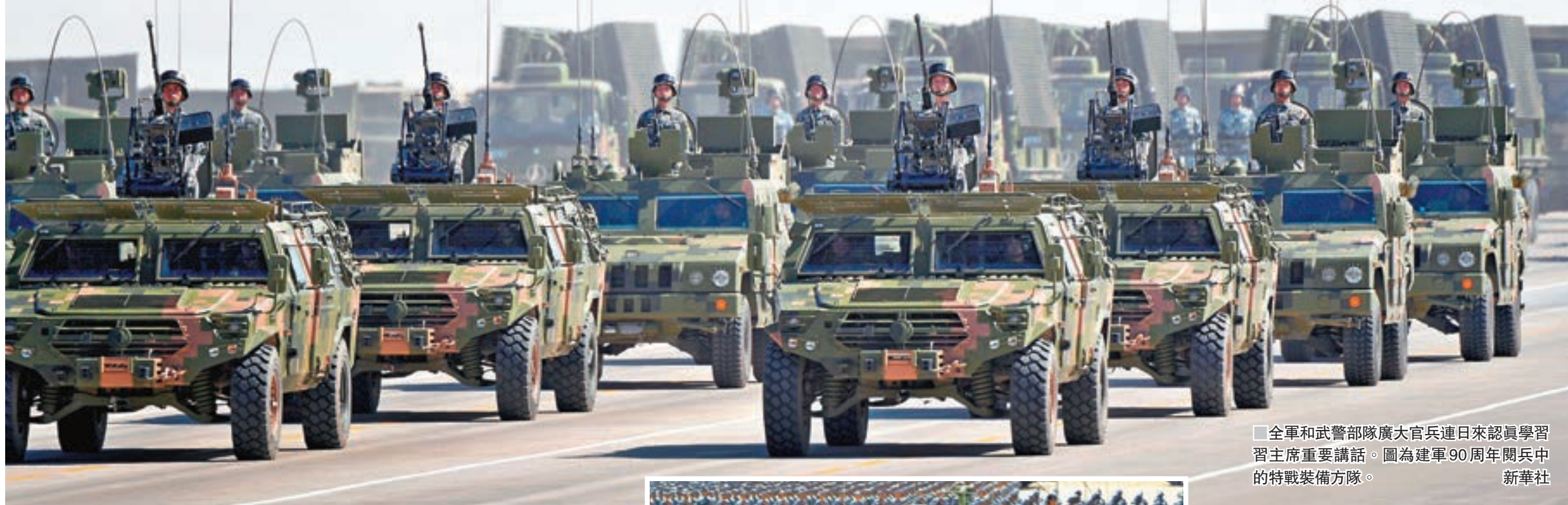
全軍和武警部隊廣大官兵連日認真學習習主席重要講話。圖為建軍90周年閱兵中的特戰裝備方隊。