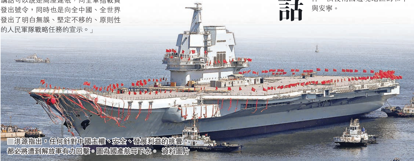
洪源指出，任何針對中國主權、安全、發展利益的挑釁，都必將遭到解放軍有力回擊。圖為國產航母下水。