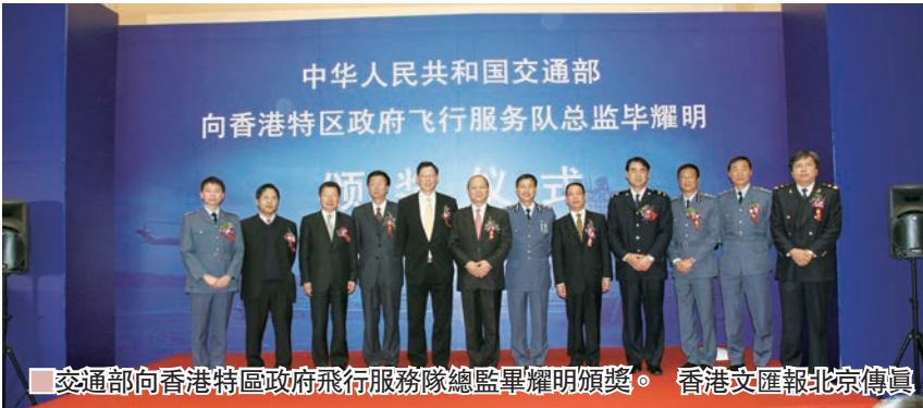
■交通部向香港特區政府飛行服務隊總監畢耀明頒獎。

香港的飛行服務隊是在港英政府統治下建立的，歷史悠久、技術完善、經驗豐富，在海上飛行救助領域屢建奇功，在國際飛行救助領域也享有極高的聲譽。如能得到香港飛行救援隊的幫助，內地飛行救