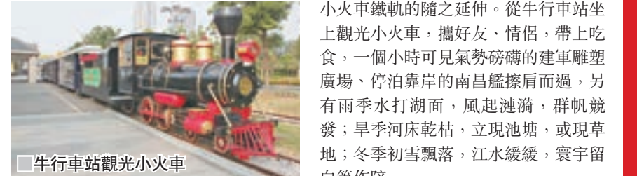
牛行車站觀光小火車。

小火車鐵軌的隨之延伸。從牛行車站坐上觀光小火車，攜好友、情侶，帶上零食，一個小時可見氣勢磅礴的建軍雕塑廣場、停泊靠岸的南昌艦擦肩而過，另有雨季水打湖面，風起漣漪，群帆競發；旱季河床乾枯，立現池塘，或現草地；冬季初雪飄落，江水緩緩，寰宇留白等作陪。 下午則開車至新城另一端。南昌軍事主題公園，係提升國防教育與愛國主義教育相融合的載體。其中，軍事裝備展示中心以「紅動贛江」為主題，分為空軍、陸軍、輕武器裝備展示區，囊括殲擊機、轟炸機、運輸機、教練機等軍用飛機、榴彈炮、加農炮、高射炮、火箭炮等火炮，坦克、水陸兩棲坦克、履帶式裝甲輸送車、履帶式步兵戰車等軍用車，這些裝備或曾參與汶川救災、98抗洪救災、對越自衛反擊戰、中國人民解放軍空軍八一飛行表演隊、國慶35周年大閱兵等歷史性時刻。後期，南昌軍事主題公園計劃設置軍事裝備展示中心、經典戰例演示中心、軍事文化培訓中心、裝備模擬體驗中心、軍事文化旅遊集約中心等5大板塊，高精尖的軍事裝備、劍拔弩張的戰例演示、令人血脈噴張的體驗活動值得你期待。 三大景點，一線綿延數公里，觀光