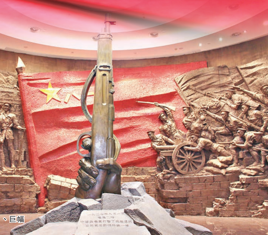
直指藍天的「第一槍」、巨幅「軍旗」及全景式高浮雕。