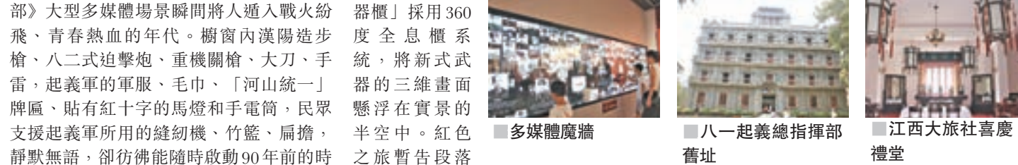
多媒體魔牆、八一一起義總指揮部舊址、江西大旅社喜慶禮堂。

後，可步行至紀念品區，購買幾款頭好。紀念館附近的是八一起義總指揮部舊址，一座灰色五層大樓，原為江西大旅社，見證了以周恩來為書記的中共前敵委員會的成立。至於在其他景點的遊覽，譬如賀龍指揮部舊址窗口殘留的彈痕、朱德舊居內的蒲扇、葉挺使用過的指揮刀，在昏黃的燈光下，靜下心沉思，金戈鐵馬、指點江山總是連番襲來。不知不覺中，夜幕降臨，移步至八一廣場，可以欣賞到軍史長廊、霧森、全國最大的矩陣式音樂噴泉、跳泉、紅色文化砂岩浮雕牆、夜景燈光秀。