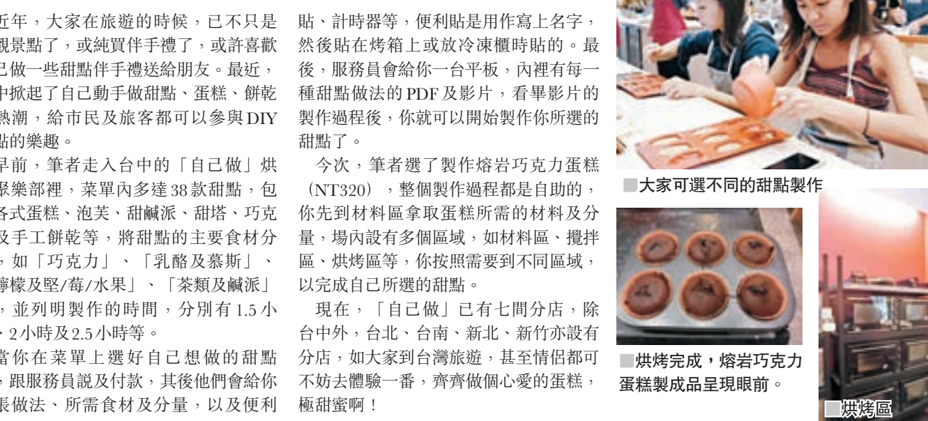
大家可選不同的甜點製作、烘烤完成，熔岩巧克力蛋糕製成品呈現眼前、烘烤區。

近年，大家在旅遊的時候，已不只是參觀景點了，或純買件手禮了，或許喜歡自己做一些甜點手禮送給朋友。最近，台中掀起了自己動手做甜點、蛋糕、餅乾的熱潮，給市民及旅客都可以參與DIY甜點的樂趣。 早前，筆者走入台中的「自己做」烘焙聚樂部裡，菜單內多達38款甜點，包含各式蛋糕、泡芙、甜鹹派、甜塔、巧克力及手工餅乾等，將甜點的主要食材分類，如「巧克力」、「乳酪及慕斯」、「檸檬及堅/莓/水果」、「茶類及鹹派」等，並列明製作的時間，分別有1.5小時、2小時及2.5小時等。 當你在菜單上選好自己想做的甜點後，跟服務員說及付款，其後他們會給你一張做法、所需食材及分量，以及便利貼、計時器等，便利貼是用作寫上名字，然後貼在烤箱上或放冷凍櫃時貼的。最後，服務員會給你一台平板，內裡有每一種甜點做法的PDF及影片，看畢影片的製作過程後，你就可以開始製作你所選的甜點了。 今次，筆者選了製作熔岩巧克力蛋糕(NT$320)，整個製作過程都是自助的，你先到材料區拿取蛋糕所需的材料及分量，場內設有多個區域，如材料區、攪拌區、烘烤區等，你按照需要到不同區域，以完成自己所選的甜點。 現在，「自己做」已有七間分店，除台中外，台北、台南、新北、新竹亦設有分店，如大家到台灣旅遊，甚至情侶都不妨去體驗一番，齊齊做個心愛的蛋糕，極甜蜜啊！