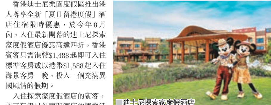
迪士尼探索家度假酒店。

香港迪士尼樂園度假區推出港人尊享全新「夏日留港度假」酒店住宿限時優惠，於今年8月內，入住最新開幕的迪士尼探索家度假酒店優惠高達四折，香港賓客只需港幣$1,488起即可入住標準客房或以港幣$1,588起入住海景客房一晚，投入一個充滿異國風情的假期。 入住探索家度假酒店的賓客，亦可玩盡另外兩間酒店的康樂活動及設施。早上可在香港迪士尼樂園酒店與高飛一起耍太極；下午可在迪士尼探索家度假酒店「雨澄泳池」參與迪士尼朋友泳池派對；晚間到迪士尼好萊塢酒店「鋼琴形泳池」，坐在兒童迷你汽車上，恍如美國露天汽車電影院般欣賞經典迪士尼電影。 入住酒店期間，賓客可到香港迪士尼樂園體驗全新「Marvel 夏日超級英雄」，賓客更可製作專屬神盾局特工身份證，加入神盾局，與一眾超級英雄並肩作戰。於「鐵甲奇俠飛行之旅」與鐵甲奇俠穿梭於香港鬧市，美國隊長及蜘蛛俠都已經做好準備與各神盾局特工會面。 為了令Marvel超級英雄的粉絲有更全面的體驗，入住酒店期間，可額外以港幣$600，享用「超級英雄」主題房間佈置，包括「超級英雄」主題床旗佈置、拖鞋、鏡面裝飾及門貼裝飾，更送上香港迪士尼樂園限定版Marvel漫畫一本及火箭餐廳指定鐵甲奇俠主題套餐一客，為賓客的夏日住宿添上英雄色彩。 今個夏天，就讓一家人留港度假，玩盡「Marvel 夏日超級英雄」及入住迪士尼探索家度假酒店，體驗畢生難忘的歷險旅程。