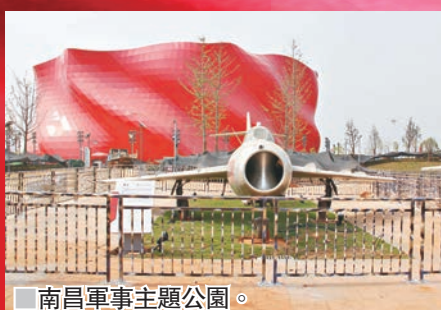
南昌軍事主題公園。