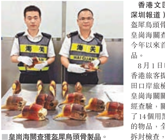
皇崗海關查獲盜犀鳥頭骨製品。

香港文匯報訊(記者何花深圳報導)一港人1日晚攜帶盜犀鳥頭骨共計14個闖關,被皇崗海關查獲。這是皇崗海關今年以來首次查獲此類動物製品。 8月1日晚22時左右,一位香港旅客提着一個行李包從福田口岸旅檢旅檢大樓出境,被皇崗海關關員攔下進行檢查。經查驗,關員在其行李內發現了14個用黑色塑膠袋密實纏繞的物品,全部為巴掌大小。經拆封檢查,關員發現這14件物品全部為鳥類頭骨。 這些鳥類頭骨有一個銅盔一樣的突起,實心,比較堅硬,套在突出的喙上面。頭骨凹凸變化,正面呈淡黃至鵝黃色,側面呈淡紅至深紅色,質地光滑細膩。 經初步鑒定,這14件鳥類頭骨全部為盜犀鳥頭骨,即傳說中俗稱的「鶴頂紅」。 當時旅客稱自己是幫人帶貨,收取帶工費300元人民幣。目前,案件已移交海關緝私部門進一步處理。