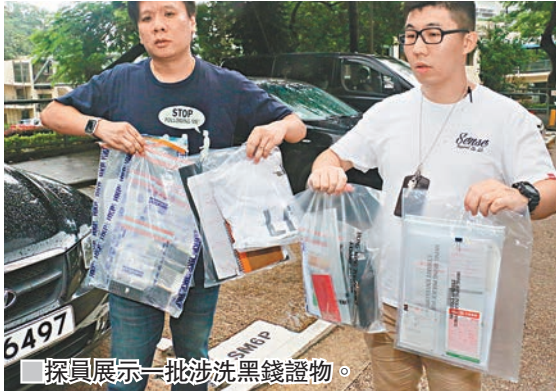
探員展示一批涉洗黑錢證物。