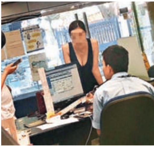
尖沙咀警署報案室疑有警長偷拍女報案人的照片,並在網上瘋傳。網上圖片

根據《警察(紀律)規例》列明,警務人員違紀行為包括「對良好秩序及紀律有損的行為」。有資深警務人員指,倘有警務人員涉及違紀行為,會面臨紀律聆訊,如有關控罪成立,主審官會根據案情嚴重程度作出處分,包括警誡、譴責、嚴厲譴責、沒收不多於1個月的薪金、降級、立即辭職、迫令退休及革職等,其中迫令退休或可保留全部或部分退休福利,但被革職則必會褫奪退休福利。