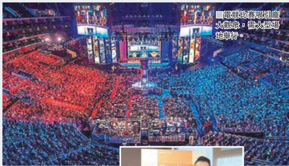
■「電競比賽吸引龐大觀眾，需大型場地舉行。」

香港文匯報訊(記者 張美婷)旅發局本周五舉辦「香港電競音樂節」，會計師事務所羅兵咸永道昨發表報告指出，亞洲電子競技市場規模在2021年將達到350億美元，現在全世界電子競技觀眾和愛好者中，有超過一半在亞太區，增長潛力巨大。報告指，香港有3項優勢條件可以成為國際電子競技的樞紐，預計香港電子遊戲收入在2021年將達到10億美元(約78億港元)，複合年均增長率6.6%。