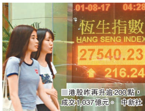
■港股昨再升逾200點，成交1,037億元。