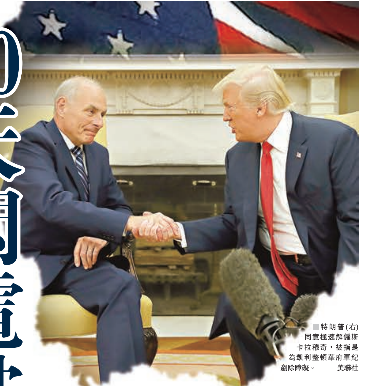
■ 特朗普(右)同意極速解僱斯卡拉穆奇，被指是為凱利整頓華府軍紀剷除障礙。