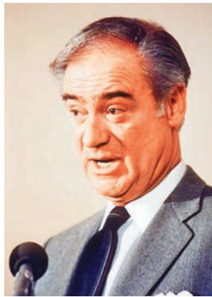
■ 前通訊主任克勒僅上任11天。