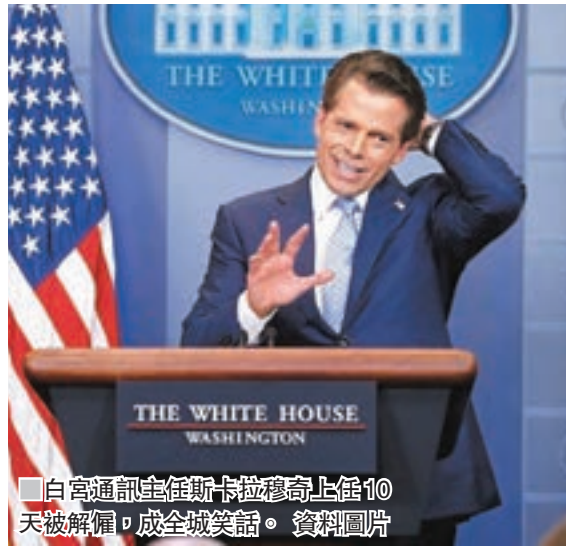
■ 白宮通訊主任斯卡拉穆奇上任10天被解僱，成全城笑話。資料圖片

美國白宮再有人事大變動，退役將領、新任幕僚長凱利前日就職，當天在任僅10日的白宮通訊主任斯卡拉穆奇突然遭革職。斯卡拉穆奇上周用粗口辱罵前幕僚長普里巴斯，加上經常吹噓自己和總統特朗普的關係，令特朗普和凱利大為不滿，故兩人皆有意辭退他。分析指，特朗普同意極速解僱斯卡拉穆奇，是要為凱利整頓華府「軍紀」剷除障礙。