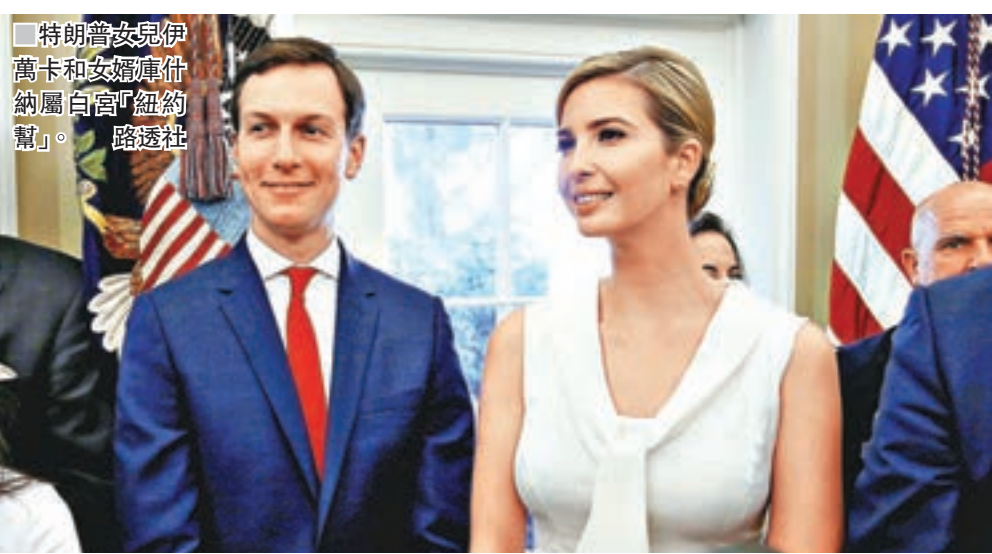
■ 特朗普女兒伊萬卡和女婿庫什納屬白宮「紐約幫」。

白宮山頭林立、內部權鬥不斷，主要派系有特朗普女兒伊萬卡和女婿庫什納的「紐約幫」，還有共和黨傳統勢力，以及特朗普在政府內外的保守派盟友，例如首席策略師班農。特朗普當初任命斯卡拉穆奇為通訊主任，正是看中他敢於批評，為特朗普自身利益發聲，但斯卡拉穆奇明顯「過了火位」，甚至喧賓奪主，令特朗普也難以忍受，決定下手。