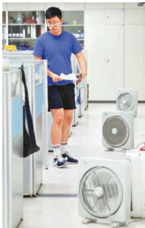
台灣公營機構昨日前帶頭省電,辦公室下午1時至3時不開冷氣,改用電扇。

有台灣地區立法機構助理抨擊該政策虛偽,公營部門是用電大戶,在最熱的時間限電只會降低效率。真正成功的電力轉型政策,是伴隨着台灣的經濟發展,讓供電跟得上發展的速度,但當局的供電是要大家不要開冷氣,還不如叫大家都去百貨公司吹冷氣好了。