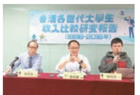
■新論壇及新青年論壇昨日發表大學生收入比較研究報告。

香港文匯報訊(記者 文森)有研究比較近20年各世代大學生的收入狀況,發現整體勞工收入中位數比20年前上升近30%,但大學學歷勞工的中位數收入卻下跌5.5%,反映大學學歷勞工的優勢,已不再如過往般明顯。研究亦認為,數據反映學歷和職位錯配問題有惡化趨勢。