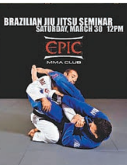
■走高檔路線、標榜是本港首間以綜合格鬥為主題的「Epic MMA Club」健身中心,周一晚突然結業。

懷疑涉及違反《商品說明條例》的個案時,需要考慮個別事件的實際情況及相關證據,才能判斷該個案是否有抵觸。