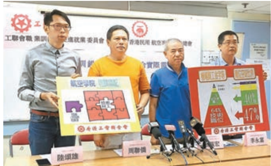
■有工會質疑新成立的航空學院推出的航空課程,只側重培訓管理人員,未能配合機場實際需要。

香港文匯報訊(記者 翁麗娜)機場三跑預料6年後落成,屆時需額外聘請5萬名員工維持運作;但工聯會昨日引述機管局2015年資料,指機場職位約64%屬於飛機維修員等技術職位,相關空缺佔機場全部空缺的47%,惟新成立的香港國際航空學院推出的航空課程,只側重培訓管理人員,質疑未能配合機場實際需要。機管局回應指,十分關注機場業務夥伴面對人手短缺情況。