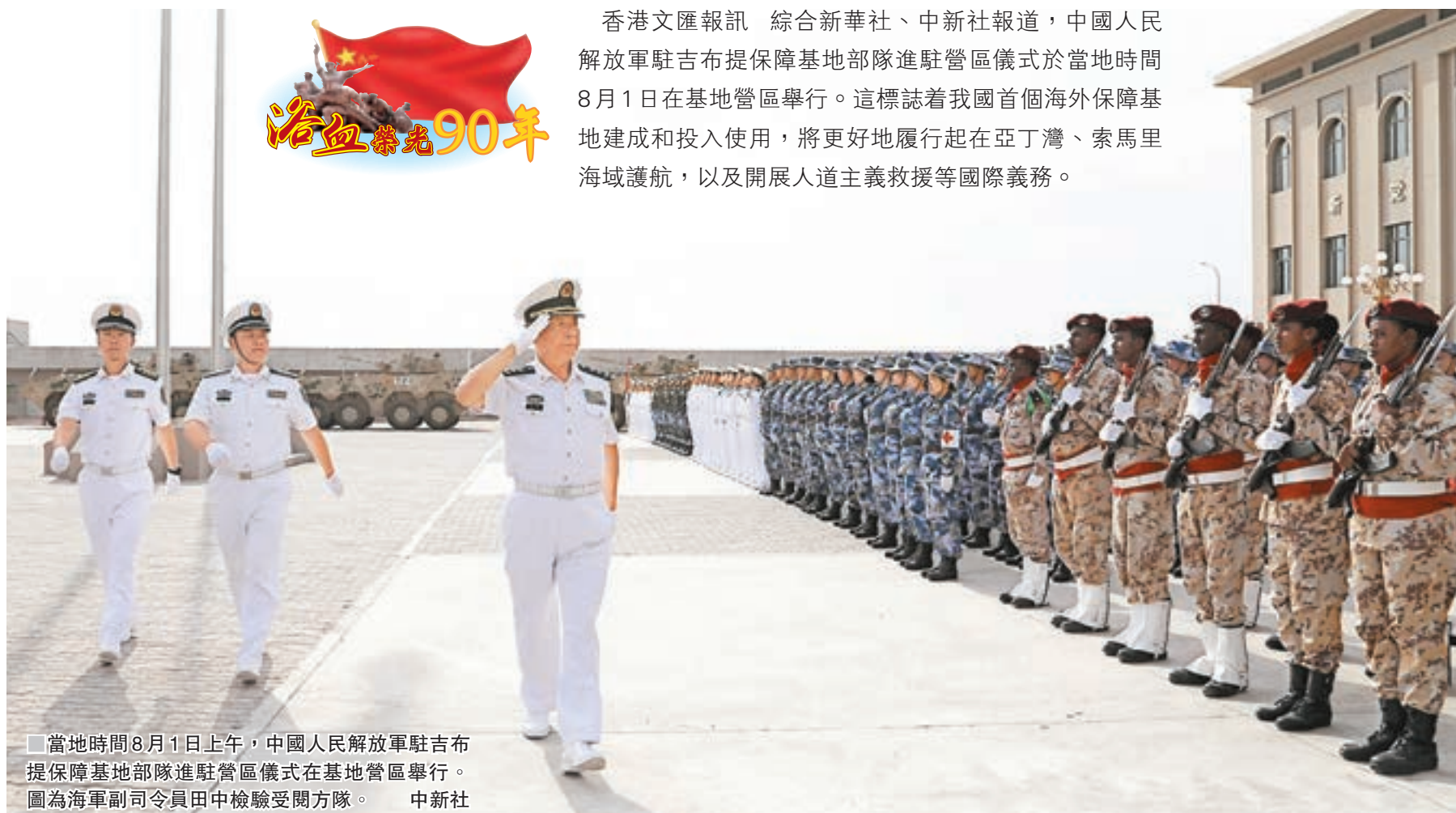
當地時間8月1日上午，中國人民解放軍駐吉布提保障基地部隊進駐營區儀式在基地營區舉行。圖為海軍副司令員田中檢驗受閱方隊。

香港文匯報訊 綜合新華社、中新社報道，中國人民解放軍駐吉布提保障基地部隊進駐營區儀式於當地時間8月1日在基地營區舉行。這標誌着我國首個海外保障基地建成和投入使用，將更好地履行起在亞丁灣、索馬里海域護航，以及開展人道主義救援等國際義務。