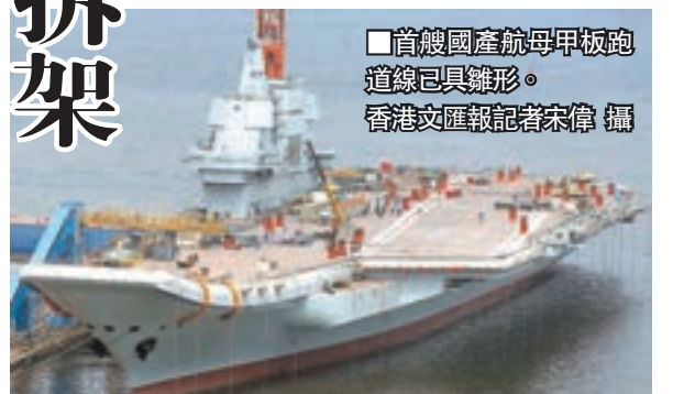
首艘國產航母甲板跑道線已具雛形。

值得一提的是，環繞國產航母兩側船舷，有數十條線纜垂入水中，預料正在進行消磁作業。消磁即降低艦艇的磁場，使其低於磁性武器磁引靈敏度，以實現保護艦艇本身的目的。事實上，消磁是所有軍艦及潛艇出廠前的必需措施。