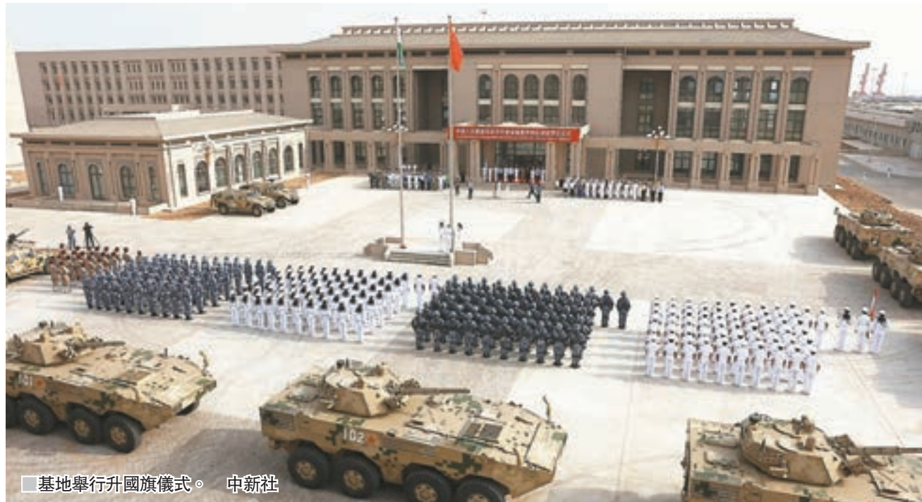
基地舉行升旗儀式。