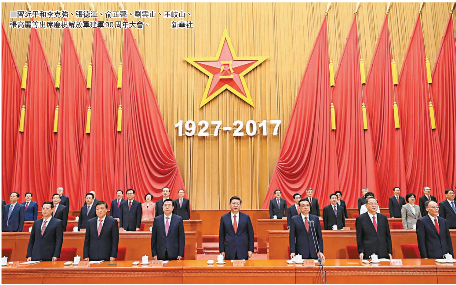
■ 習近平和李克強、張德江、俞正聲、劉雲山、王岐山、張高麗等出席慶祝解放軍建軍90周年大會。