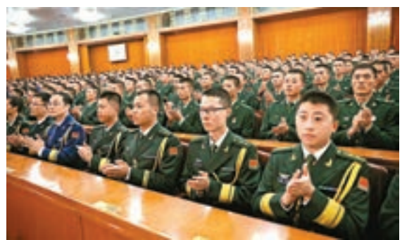
■ 習近平在大會上發表重要講話，贏得現場近四千萬各界參會代表們至少十多次雷鳴般的掌聲。

習近平指出，要增強全軍法治意識，加快構建中國特色軍事法治體系，加快實現治軍方式根本性轉變。