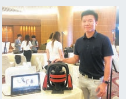
Move It 由四種健身器材組合而成。

在小米官網米家上購買, 產品 3 個月已在全球賣出 5,000 件左右, 相關 App 擁有一萬多個用戶。