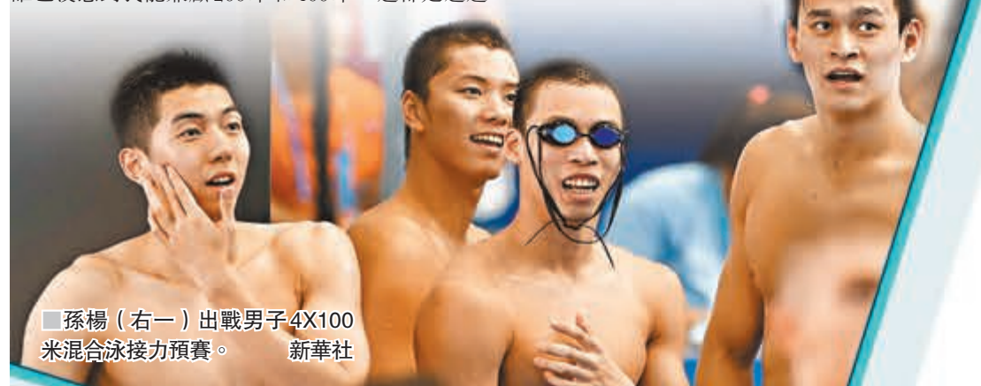
■孫楊（右一）出戰男子4X100米混合泳接力預賽。

陳運鵬稱，中國游泳的情況令人振奮，奧運冠軍孫楊以及徐嘉余、傅園慧都取得了不錯的成績。史婧琳等名將狀態正佳，還湧現了一大批年輕的實力派新人，參加準決賽和決賽的中國選手有所增多，項目更加百花齊放——孫楊的200米、400米、800米自由泳；徐嘉余和李廣源的背泳；閔子貝和覃海洋撐起蛙泳；蝶泳的李朱濠游出100米最好成績，汪順和覃海洋在混合泳佔據一席之地。