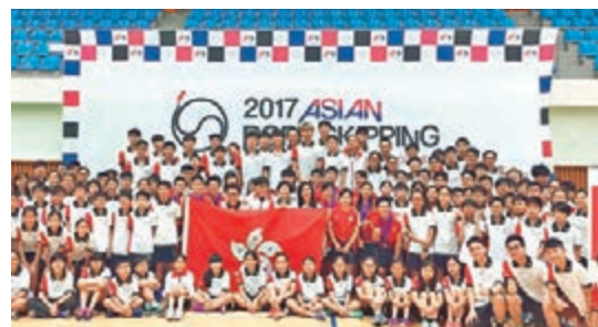
■香港跳繩代表隊在亞錦賽勇奪27金。

港隊刷新了的三項亞洲紀錄包括：男子團體HK01憑632下打破了「15歲或以上男子4×45秒交互繩速度接力賽」紀錄；女子團體HK06憑371下打破了「15歲或以上女子4×30秒單人繩速度接力賽」紀錄以及女子團體HK07憑573.5下打破了「15歲或以上女子4×45秒交互繩速度接力賽」紀錄。港隊大軍今晚載譽而歸。